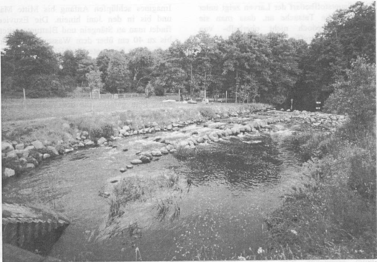
Abb. 2: Künstlich angelegtes Wildwasser an der Warnow bei Warnowhof. Hier wird viel Sauerstoff eingetragen. Gewässer dieses Ausbaus locken aber auch viele Boote an.