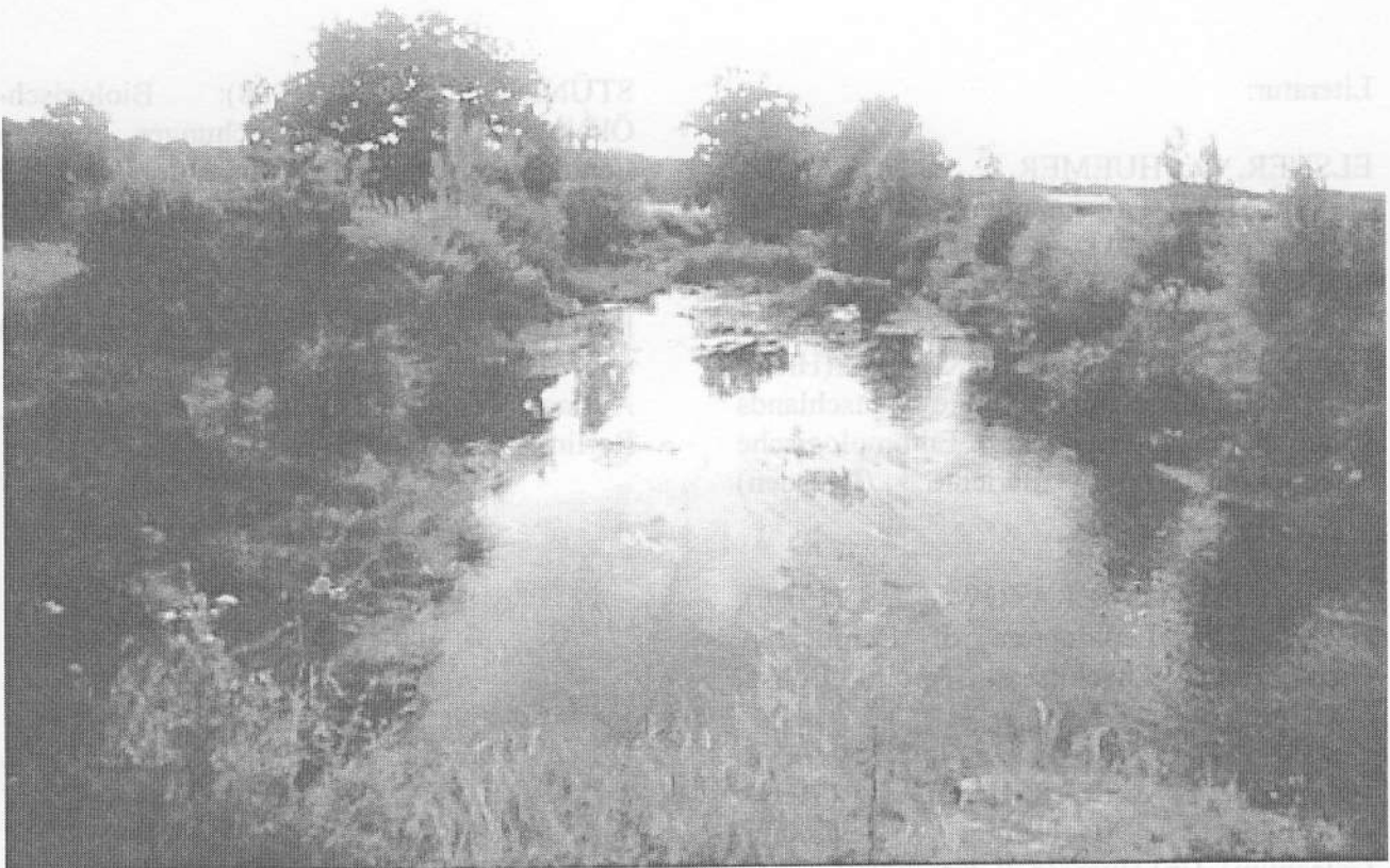
Abb. 1: Eines der wertvollsten Fließgewässer im Land ist die Warnow. Hier ist sie bei Warnowhof zu sehen.

Diese schöne Libellenart besiedelt ganz Europa bis zur Eismeerküste und erreicht im Osten Japan. Die Larven bevorzugen kühle, sauerstoffreiche Bäche mit lichten Ufergehölzen und Sommertemperaturen zwischen 13 und 18 C sowie einer optimalen Fließgeschwindigkeit um 60 cm/sec. Gegen Verschmutzung reagieren sie empfindlich.