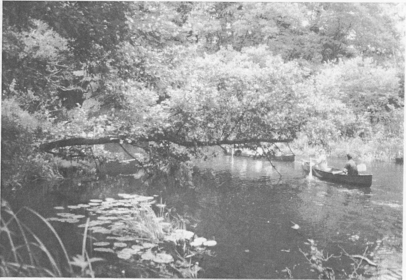
Abb. 3: Der seit der Wende zunehmende Bootsverkehr auf der Warnow (hier bei Klein Raden an einem Julitag 2001) zeigt noch keine negativen Auswirkungen auf die Gewässerqualität und Libellenfauna.