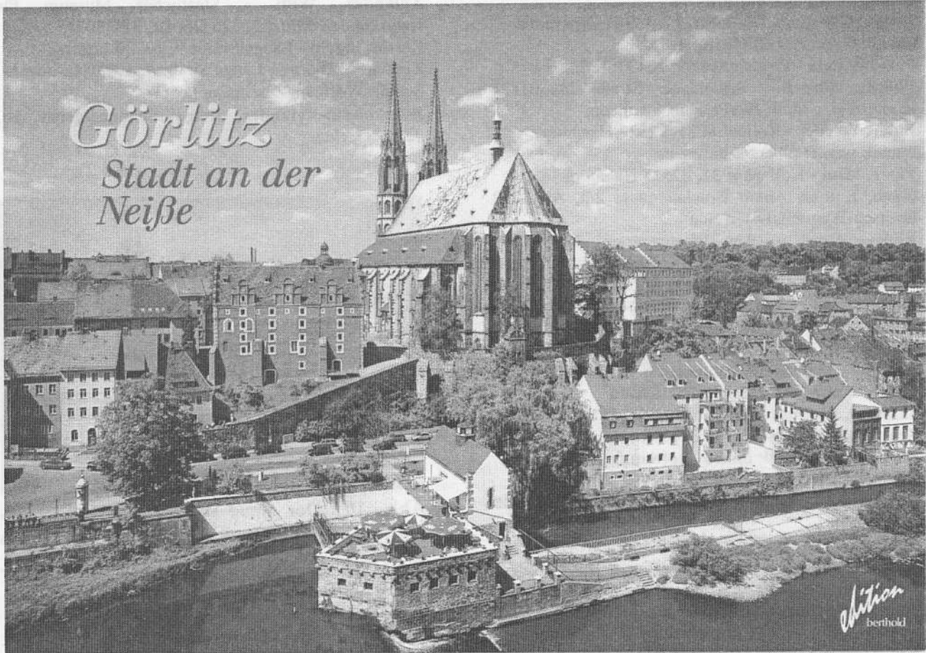
Abb. 12: Das schöne Görlitz, Foto: D. Berthold, Dresden

Teilnehmer zusammen, die am XVI. Internationalen Symposium der Odonatologie, das im Juli in Novosibirsk stattfand, teilnahmen. Hier wurden