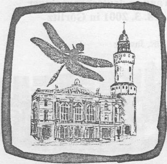
Abb. 2: Logo der 20. Tagung deutschsprachiger Odonatologen in Görlitz

Diese schlesische Stadt hatte ich bisher nur "en passant" und flüchtig kennen gelernt. Neben schönen Bürgerhäusern, einem interessanten Rathaus und der architektonischen Stadtkrone besitzt sie auch ein Naturkundemuseum der Extraklasse.