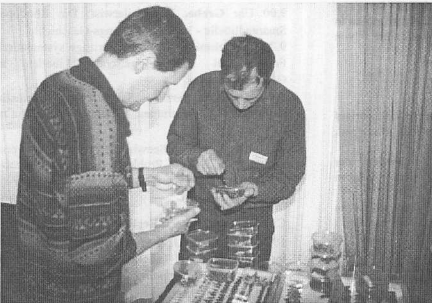
Abb. 6: Von allen gut gelitten ist das Einsammeln von Exuvien und der Exuvientausch, weil einerseits mit diesen Häutchen besser als mit Imagines Fragestellungen beantwortet werden können und andererseits kein Tier getötet werden muß.