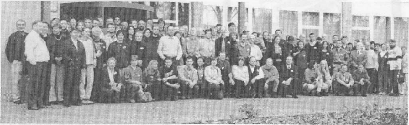
Abb. 1 Die Tagungsteilnehmer auf einen Blick