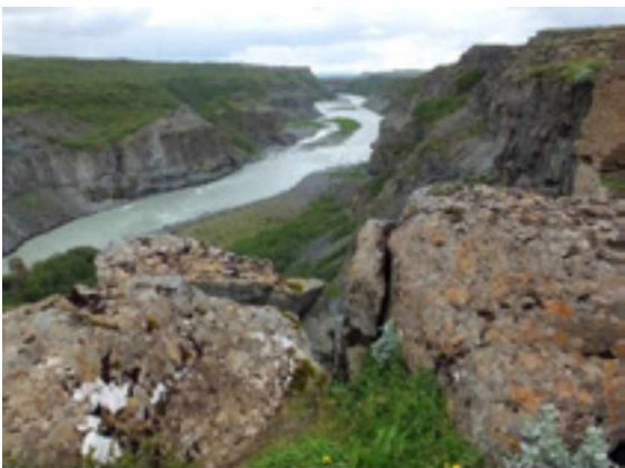
Abb. 2: Der Canyon des Gullfoss im Süden Islands.