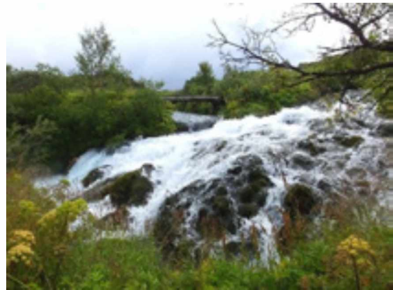
Abb. 5: Im Norden – Schlucht des Hljodaklettur (Echofelsen).