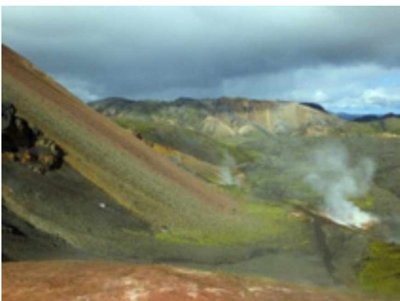
Abb. 3: Auf der Hochebene – Vulkanismus und Liparitgestein in Landmannalaugar.