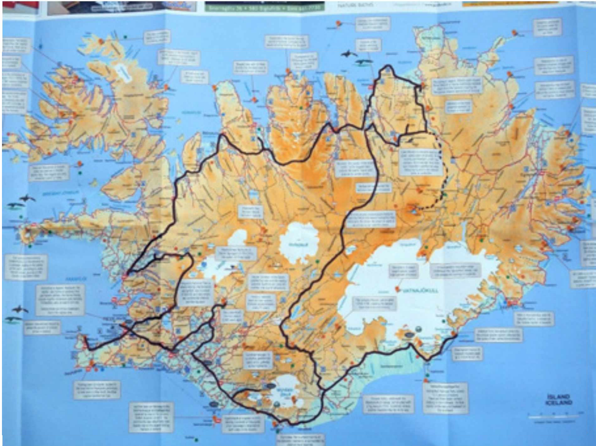
Abb. 7: Exkursionsroute durch Island (Basis: Ausschnitte aus einer Karte der isländischen Touristenagentur).