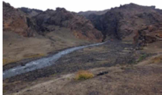
Abb. 4: Vulkanismus und Liparitgestein in der Bimssteinebene der Askja auf der Hochebene.