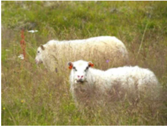
Abb. 11: Schafbeweidung am Lachsfluss im Nationalpark Thingvellir.