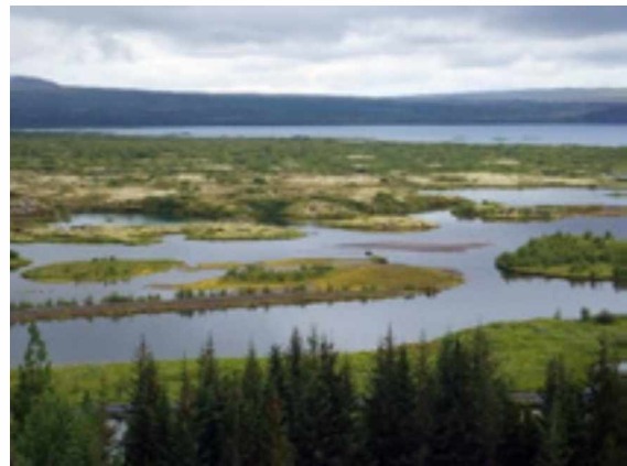
Abb. 6: Kontinentalspaltensystem im Nationalpark Thingvellir im Norden der Insel.

Die Exkursion fand im August 2017 statt. Die Route durch Island wird in Abb. 7 veranschaulicht. Bis auf den östlichen und äußersten westlichen Teil (Westfjorde) wurden große Gebiete innerhalb von 14 Tagen bereist. Bei den getätigten Beobachtungen handelt es sich um keine systematischen Untersuchungen.