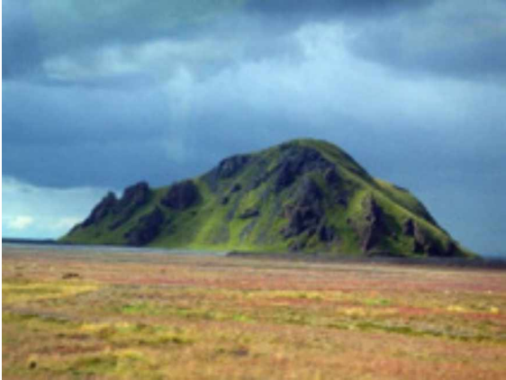
Abb. 1: Der Süden – Ebene im südlichen Bereich Islands mit Krater.

Moose, Flechten und Bärlappe. KRISTINSSON (2013) gibt einen guten Überblick über die Flora Islands. Die Abbildungen 1-6 illustrieren die unterschiedlichen Naturräume vom Süden über die große Hochebene bis in den Norden.