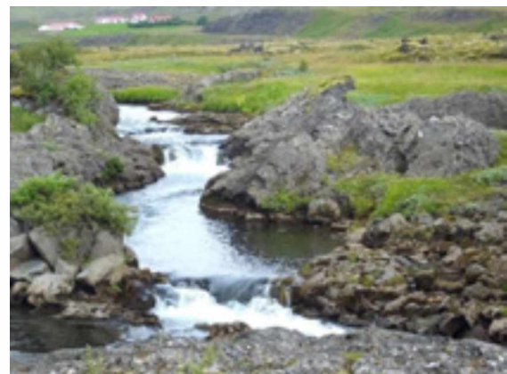
Abb. 10: Blick in das landwirtschaftlich extensiv genutzte Gebiet um den Lachsfluss im Nationalpark Thingvellir.

Insgesamt gesehen, ist Island ein auch für Entomologen reiches Land. Es haben sich durch die Isolationen viele Formen von Arten herausgebildet, die es sich lohnt, anzuschauen. Zudem dürfte die entomologische Bearbeitung der Gebiete noch lange nicht abgeschlossen sein. Wer hier beobachtet, sollte Zeit mitbringen, da das Land groß und in vielen Teilen unerschlossen ist. Zudem spielt das Wetter eine entscheidende Rolle. Die besten Zeiten, entomologische Untersuchungen anzustellen, sind der späte Juni und der Juli.