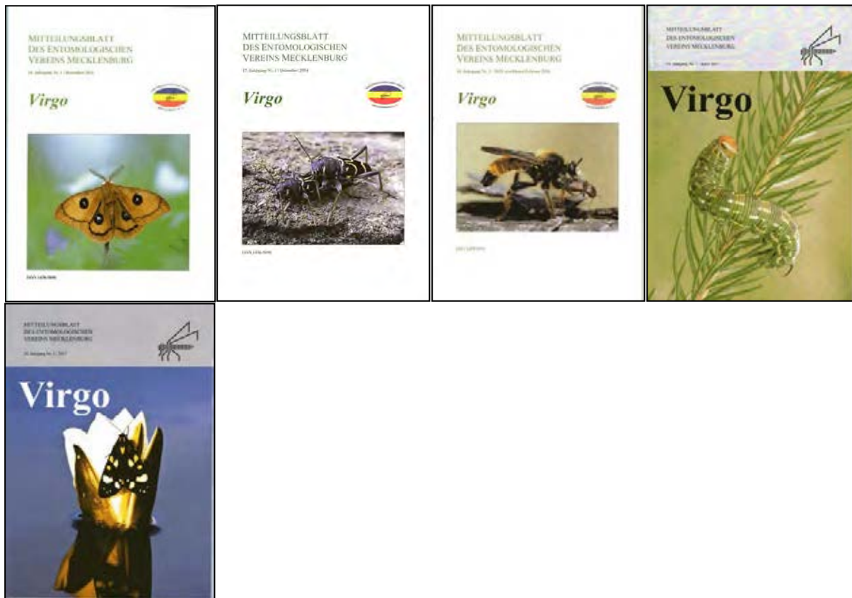
Abb. 2: Titelblätter der Jahrgänge 16-20 „Virgo“ (2013-2017).