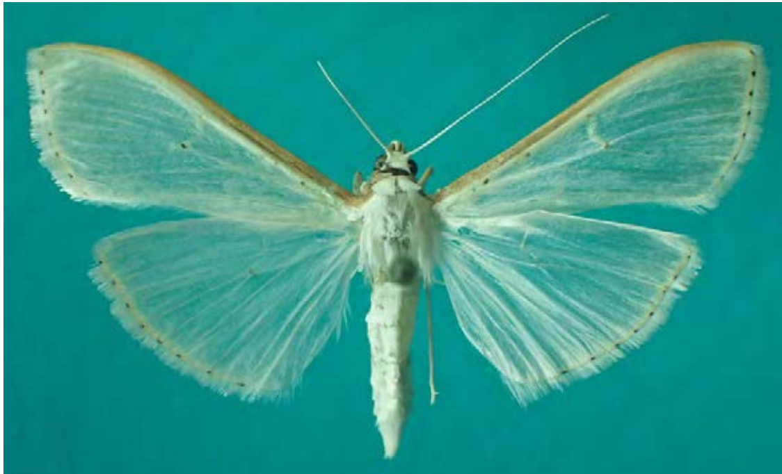
Abb. 1: Palpita vitrealis (30 mm) aus Buchholz bei Rubow in Mecklenburg.