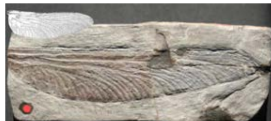
Abb. 3: Der Libellenflügel der Urlibelle Stephanotypus schneideri (ca. 20 cm) aus dem Oberkarbon von Plötz in der Vergrößerung – dazu im Vergleich der Flügel einer heutigen rezenten Großlibellenart ( Anisoptera ).