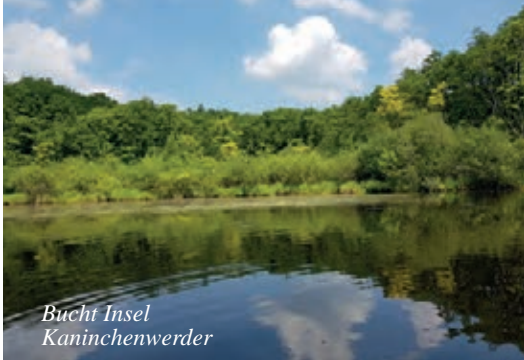
Bucht Insel Kaninchenwerder