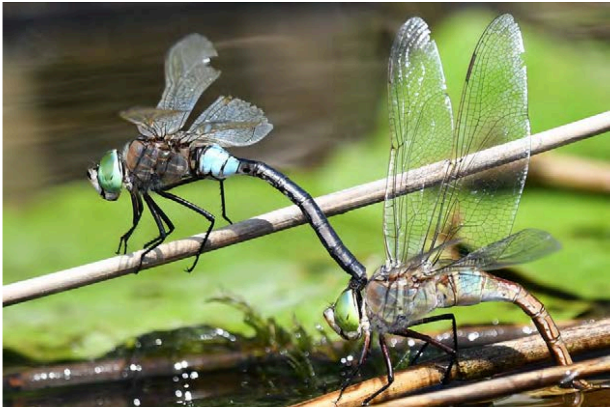
Kleine Königslibellen Anax parthenope (Selys, 1839) bei der Paarung, Schweriner Innensee.