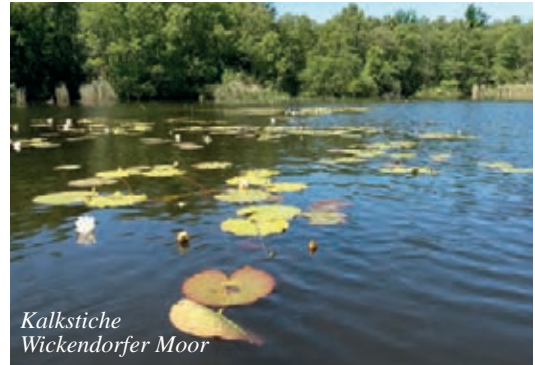
Kalkstiche Wickendorfer Moor