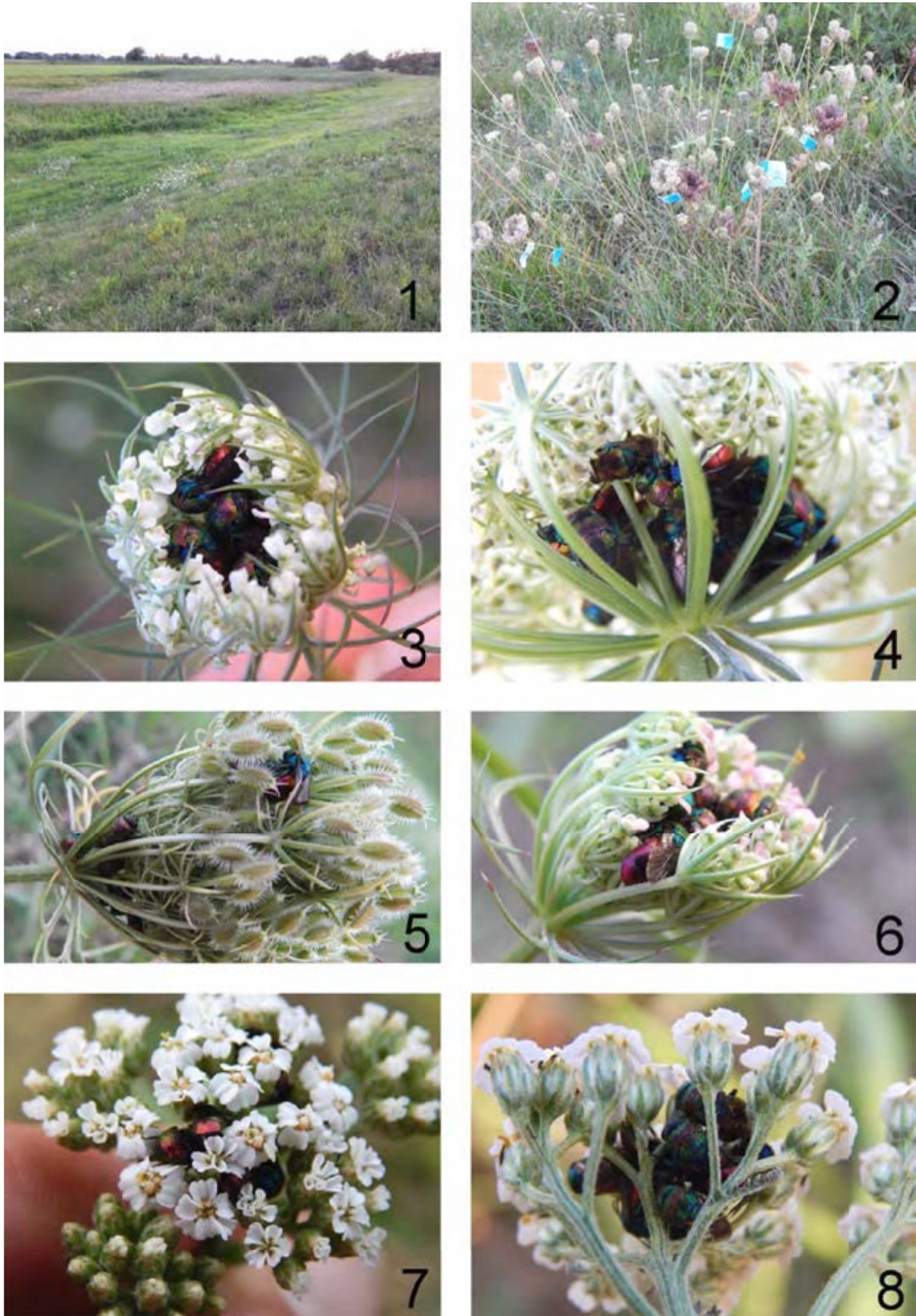
Abb. 1-8: 1: Südlicher Schenkel des Brodaer Deiches in Richtung Rüterberg. – 2: Markierte Wilde Möhre. – 3-6: Aggregation von H. rutilans auf Wilder Möhre. – 7-8: Aggregation von H. rutilans auf Schafgarbe. – (Fotos 1-8 J. Bornemann).