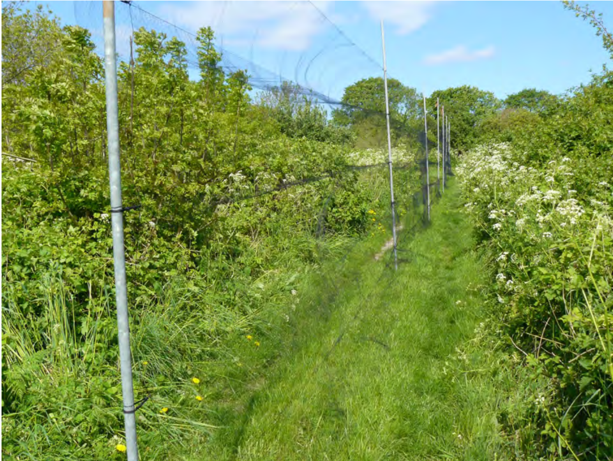
Abb. 1: Netzfangbereich auf der Greifswalder Oie im Rahmen der wissenschaftlichen Vogelberingung.