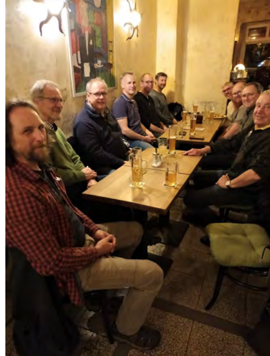
Abb. 5: In geselliger Runde wurden noch viele persönliche und fachliche Gespräche geführt.

Am Abend fand das Treffen seinen Ausklang in geselliger Runde in einer nahe gelegenen Gaststätte (Abb. 5). Hier wurden die Diskussionen fortgesetzt, neue Pläne geschmiedet und persönliche Kontakte vertieft.