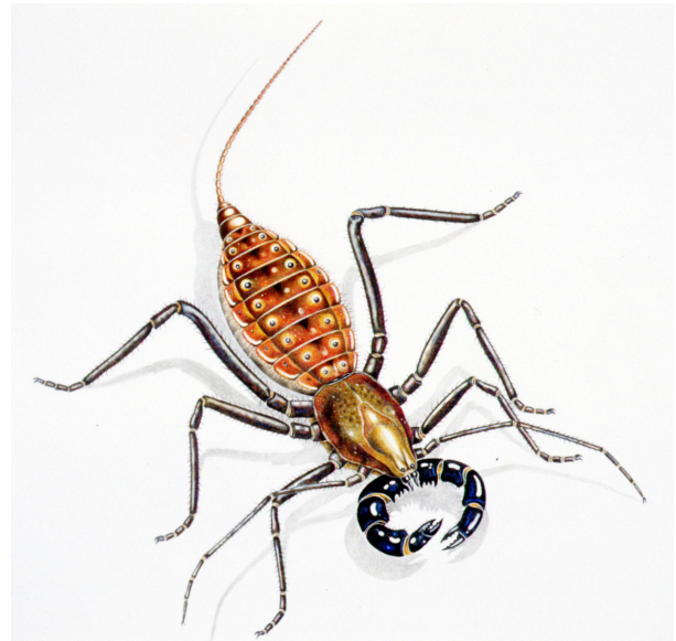
Abb. 4: Geralinura naufraga (BRAUCKMANN & KOCH, 1983), Zeichnung: Elke Gröning.

Geißelskorpione sind trotz ihres Namens mit den Skorpionen nicht näher verwandt. Kennzeichnend sind der schlanke Körper und die namensgebende lange Geißel am Hinterende. Fossil sind sie außerordentlich selten. Außer einer Art aus dem Jung-Tertiär von Kalifornien sind nur knapp 20 Fundstücke bekannt. Diese stammen alle aus dem Ober-Karbon, und zwar aus Europa und Nordamerika sowie – fraglich – aus China. Die (ohne Extremitäten) knapp 16 mm lange Geralinura naufraga von Vorhalle ist die älteste bekannte Art. Sie wurde kürzlich – anlässlich einer Revision der britischen karbonischen Geißelskorpione von DUNLOP & HORROCKS (1996) – in die Gattung Geralinura versetzt.