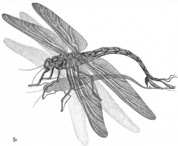
Abb. 3: Namurotypus sippeli BRAUCKMANN & ZESSIN, 1989, Zeichnung: Elke Gröning.

In der hier zitierten Publikation werden auch weitere neue Erkenntnisse zur Morphologie und zum Kopulations-Verhalten der ältesten bisher bekannten Libellen (aus dem tieferen Ober-Karbon von Hagen-Vorhalle und aus Argentinien) vorgestellt. Hierzu gehört unter anderem der Nachweis kleiner Vorderbrust-Flügelchen (= Prothoracal-Flügel) an den beiden Vorhaller Arten Erasipteroides valentini (BRAUCKMANN in BRAUCKMANN et al., 1985) und Namurotypus sippeli , nachdem dieses Merkmal zuvor schon von WOOTTON et al. (1998) und WOOTTON & KUKALOVÁ-PECK (2000) an einem fast vollständig erhaltenen, noch nicht näher beschriebenen und auch noch nicht benannten Angehörigen der Egeropteridae (Geroptera) aus dem tieferen Ober-Karbon von Malanzán, Provinz Córdoba/Argentinien erkannt worden war.