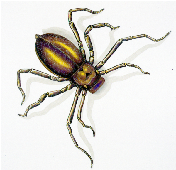
Abb. 5: Curculioides adompha BRAUCKMANN, 1987, Zeichnung: ElkeGröning.

Noch seltener als die Geißelskorpione sind die Kapuzenspinnen. Heute leben nur ca. 20 Arten (3 Gattungen). Sie alle sind auf die tropischen Regionen West-Afrikas bzw. Amerikas beschränkt. Fossil sind derzeit 25 Exemplare aus dem Ober-Karbon in Großbritannien, den USA und West-Deutschland bekannt, die sich auf 15 eindeutig bestimmbare Arten in vier Gattungen verteilen. Dabei stellt Curculioides adompha aus Vorhalle wiederum die älteste Art dar. Der einzige Fund ist (ohne Extremitäten) etwa 17 mm lang.