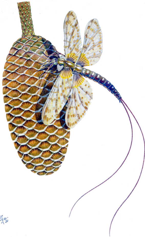
Abb. 2: Delitzschala bitterfeldensis BRAUCKMANN & SCHNEIDER, 1996, Zeichnung: Elke Gröning.

Auffällig ist der Besitz eines dritten, am Prothorax ansetzenden Flügel-Paares. Diese Vorderbrust-Flügelchen (= Prothoracal-Flügel) sind deutlich kleinflächiger als die übrigen Flügel, zeigen aber in einigen Fällen eine analoge Aderung und eine ähnliche Korngation. Mittelbrust- und Hinterbrust-Flügel (= Mesothoracal- bzw. Metathoracal-Flügel; = Vorderflügel bzw. Hinterflügel bei heutigen Insekten) überlappen einander bei den Homiopteridae beträchtlich, was in diesem Fall auch für die Flügelstellung am lebenden Tier angenommen werden muß. Bei den Spilapteriden hingegen gibt es Arten, deren Flügel einander nicht überlappen, so auch bei Delitzschala bitterfeldensis .