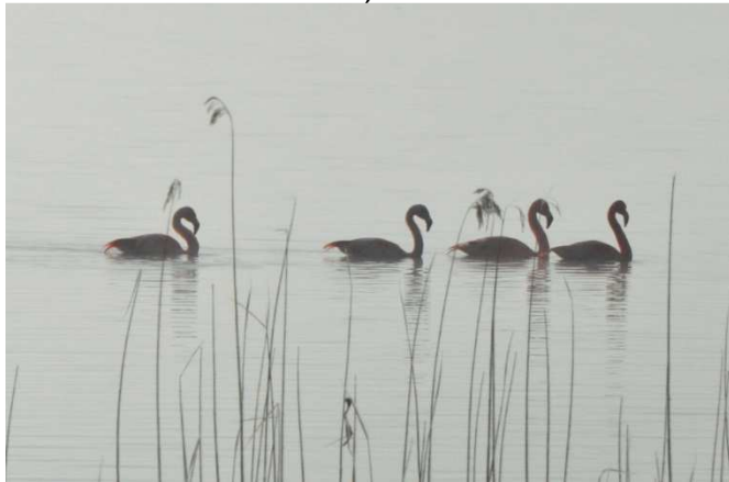
Chileflamingos am Starnberger See (Foto: Oliver Focks)

14.02.2015 4 Ind. bei der Wasservogelzählung im Bernrieder Park (CH,OF,Arne Jacobsen)