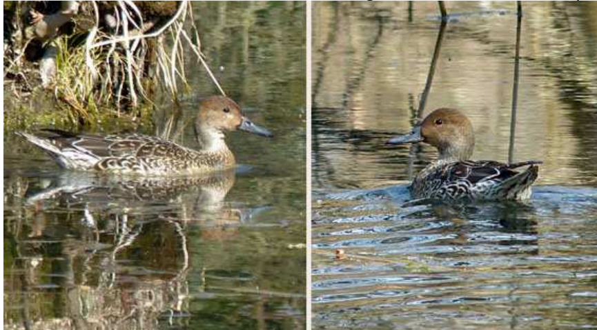
Spießente (Foto: ornitho.de - Karo Wenzel)

18.03.2015 1 Weibchen am Starnberger See bei Bernried (Karo Wenzel)