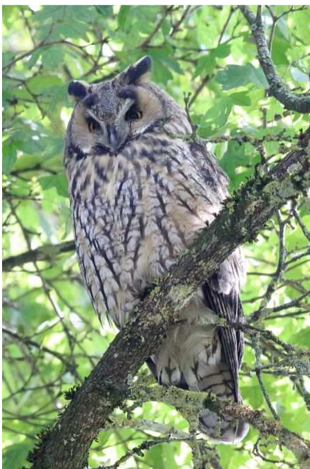
Waldohreule (Foto: ornitho.de - Peter Witzan)