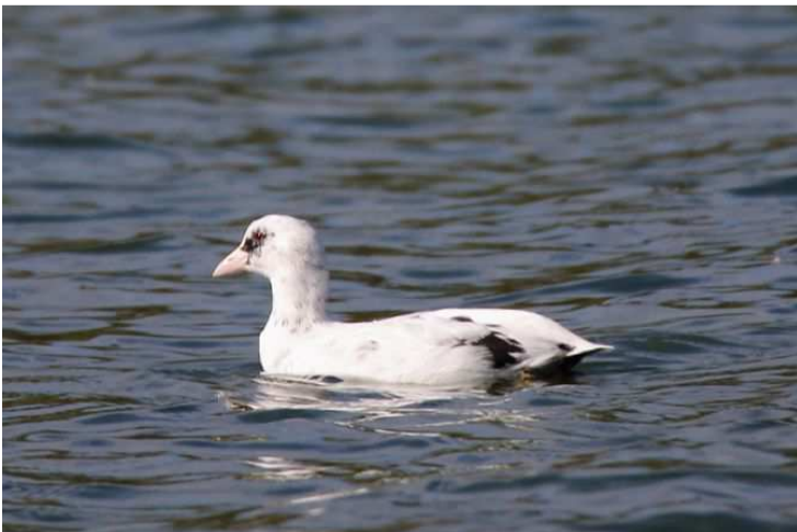
Blässhuhn, leuzistisch