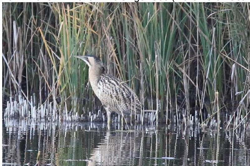
Rohrdommel (Foto ornitho.de - Peter Witzan)

19.11.2015 1 Ind. am Maisinger See (Marc Pérez Osanz)