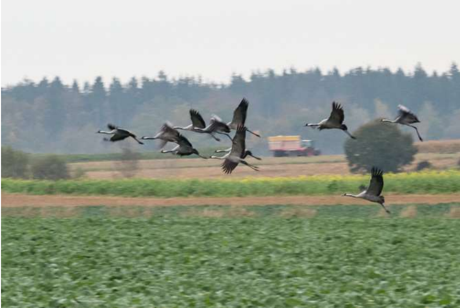
Kraniche bei Buchendorf

24.10.2019 20-50 Kraniche nachts über Gauting (Claudia Höll, Julia Höll) 25.10.2019 63 Kraniche über dem Deixlfurter See (Claudia Höll) 25.10.2019 11 Kraniche bei Buchendorf (AGei)