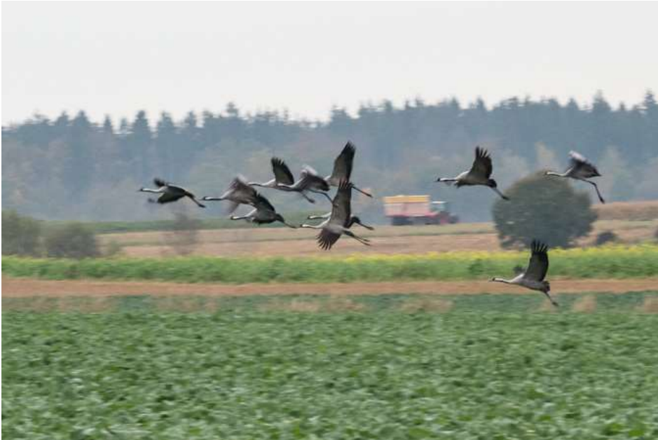
Kraniche bei Buchendorf