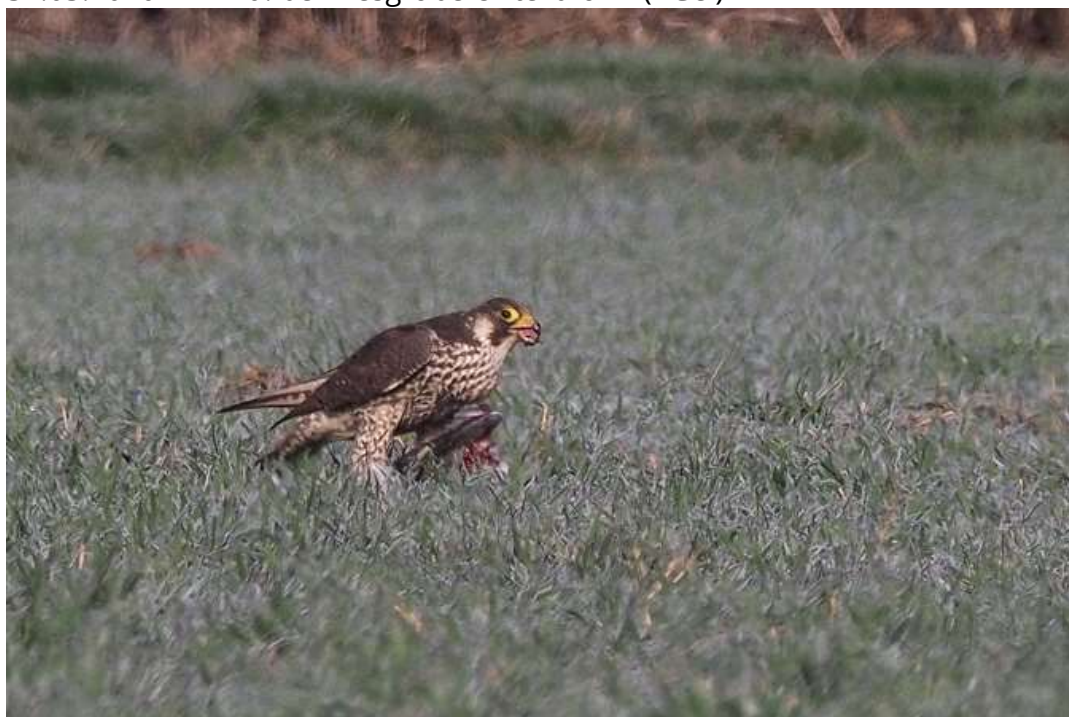
Wanderfalke – Taube rupfend

15.03.2020 1 (1,0) Ind. im Leutstettener Moos (WoS) 26.03.2020 1 Ind. bei Unering (AGei) 31.03.2020 1 Ind. bei Kiesgrube Unterbrunn (AGei)