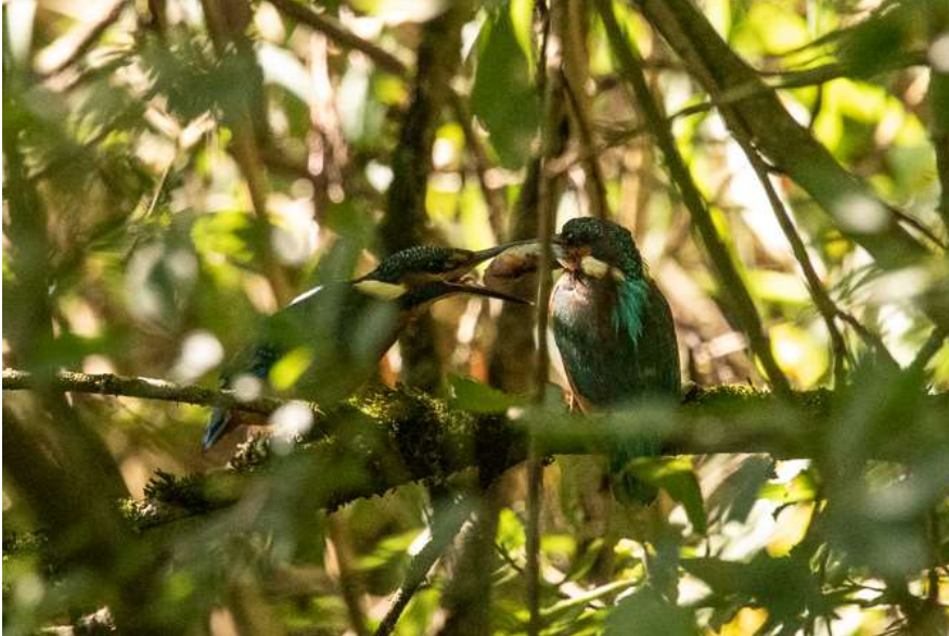
Eisvogel (fütternder Altvogel)

08.09.2020 >= 4 Ind. (fütternde Altvögel) am Maisinger See (UZW) (Brutnachweis)