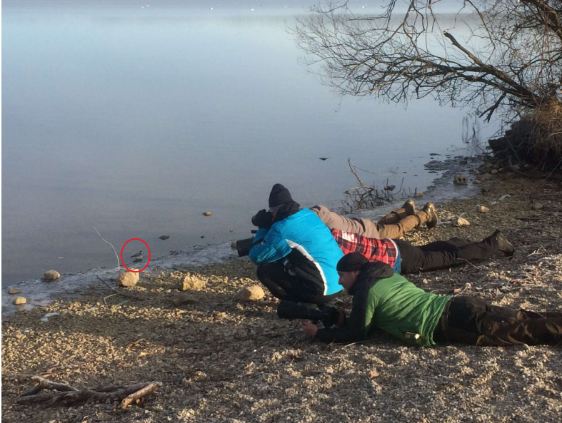
Thorshühnchen ohne Fluchtdistanz

Bis zum 29.12.2020 wurde das Thorshühnchen 68 mal im ornitho.de gemeldet. Täglich waren viele Ornithologen und Fotografen im Süden des Starnberger Sees, um diesen seltenen Gast zu beobachten. Es gibt im ornitho.de eine große Menge an ausgezeichneten Fotos dieses Vogels, der überhaupt nicht scheu ist und ohne Fluchtdistanz vor den Fotografen Nahrung sucht.