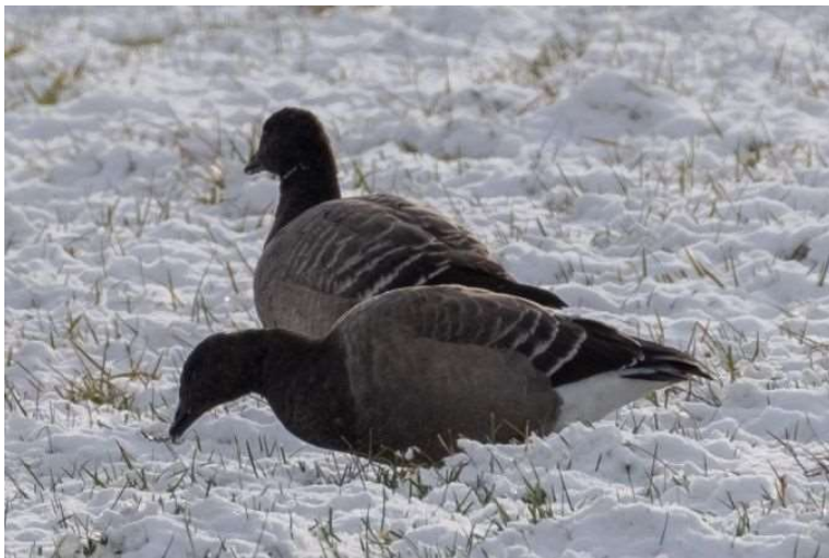
Dunkelbäuchige Ringelgans

Das ist erst die zweite Beobachtung von Ringelgänsen im Landkreis Starnberg seit Erscheinen dieser Monatsberichte.