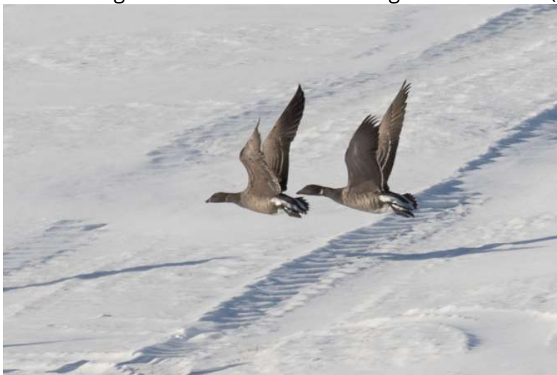
Dunkelbäuchige Ringelgans

Während des gesamten Monats Januar konnten 2 vj. Ind. regelmäßig in der Nähe des Karpfenwinkels (am Starnberger See oder auf der Gänsewiese) meist zusammen mit vielen Graugänsen beobachtet und fotografiert werden. (viele Beobachter).