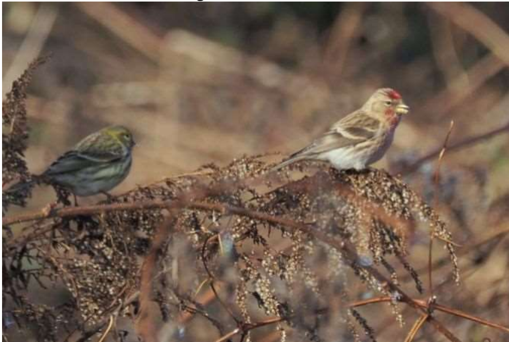
Girrlitz und Birkenzeisig

22.02.2021 1 Ind. bei Kiesgrube Oberbrunn (AGei)