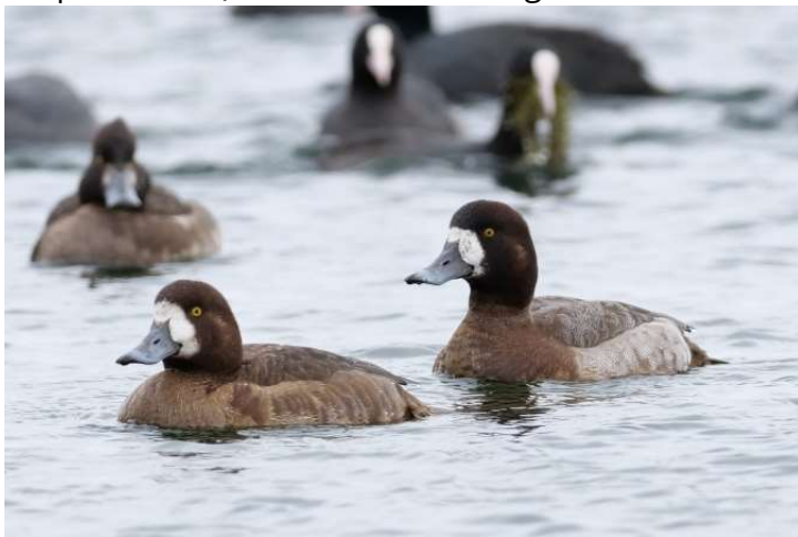
weibliche Bergenten

Während des gesamten Monats am Starnberger See (meist im Süden bis Höhe Karpfenwinkel) zu beobachten. Insgesamt 11 Beobachtungen (1-4 Ind.) (viele Beobachter)