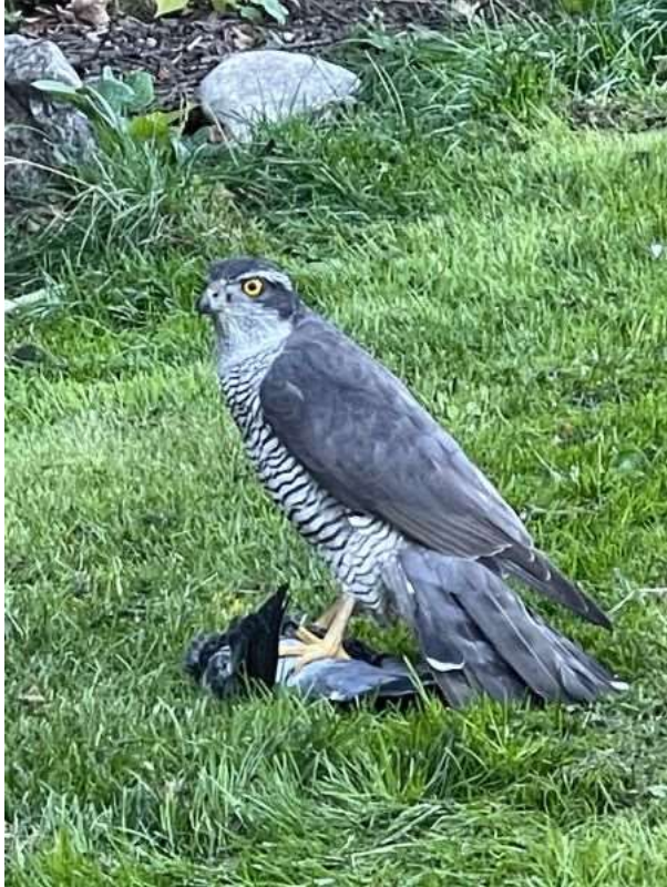
Habicht (Foto: ornitho.de – Cordula Marschner)

22.09.2022 1 Ind. bei Pöcking (Jürgen Hübler)