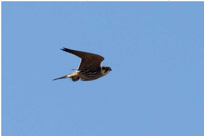
Baumfalke mit Beute

Insgesamt 21 Beobachtungen meist an den bekannten Brutplätzen bei Frohnloh, Oberbrunn, Gut Hüll (diverse Beobachter)