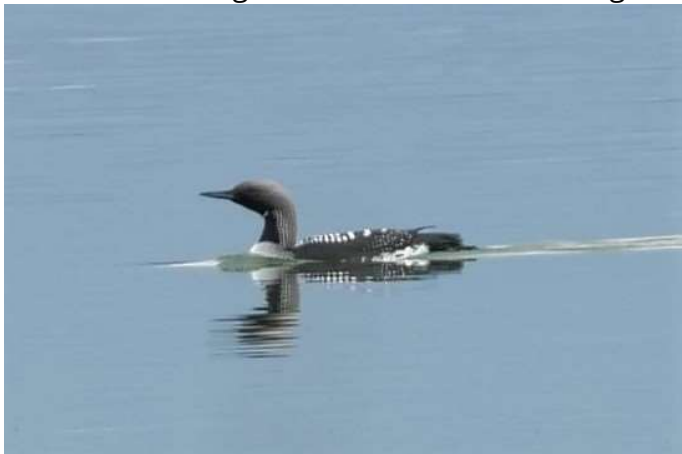
Prachtaucher im Prachtkleid

Während des ganzen Monats regelmäßig am Starnberger See zu beobachten. Teilweise bereits im Prachtkleid. Insgesamt 59 Beobachtungen (1-26 Ind.) (viele Beobachter) 21.03.2023 insgesamt ca. 65 – 70 Ind. am gesamten See (OF)