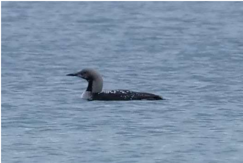
Prachttaucher im PK

Seit Mitte Oktober insgesamt 26 Beobachtungen (1 – 38 Ind.) im Süden des Starnberger Sees (mehrere Beobachter). Teilweise waren die Prachttaucher noch im Prachtkleid.