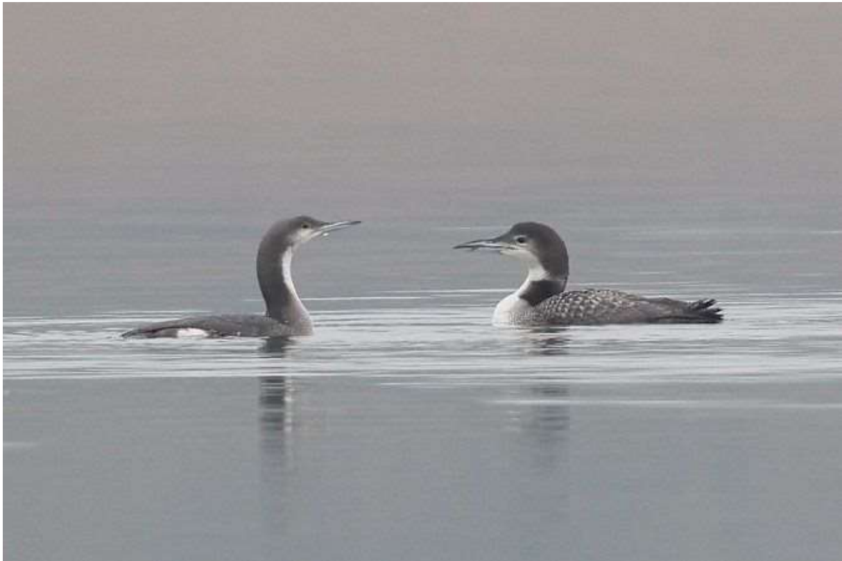
Prachttaucher (li.) und Eistaucher (re.)

Ca. 150 Beobachtungen (1-12 Ind.). Alle Beobachtungen vom Starnberger See., meist südlich von Ambach.