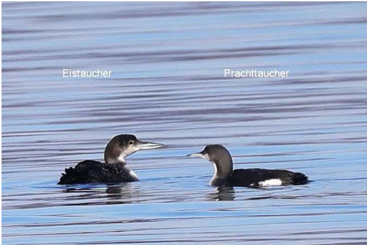
Prachtaucher (re.) und Eistaucher (li.)