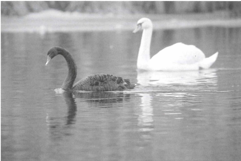
Höckerschwan und Schwarzschan auf der Eder bei Schmittlotheim, 10.12.1995