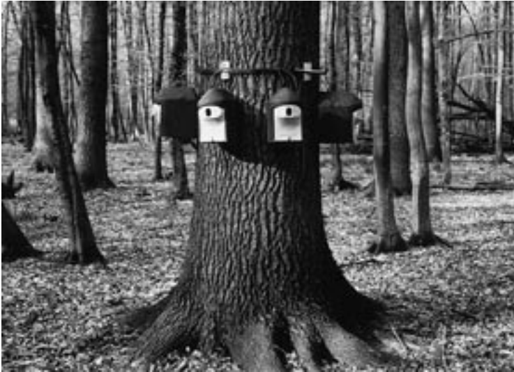
Abb. 1: Nistkastenrundell (jeweils 8 Höhlen rings um einen Eichenstamm in den 8 Haupt-Himmelsrichtungen). – Nestbox-rundell (always 8 nestboxes around an oak trunk facing into the 8 main directions).

man die Befunde aller Arten zusammen, so ergibt sich für die Ansiedlungen eine signifikante Bevorzugung von nach Osten (NE, E, SE) weisenden Nisthöhlen ( \chi^2 = 7,26 ; p = 0,01 , Fishers exact test; Abb. 2a). Am stärksten ist die Affinität für den Ostsektor beim Trauerschnäpper (68 % aller Ansiedlungen, \chi^2 = 5,90 ; p = 0,03 ; Abb. 2c). Doch ließ sich auch bei Kohlmeisen und Kleibern jeweils eine auffällige (aber bei den relativ geringen Werten für „n“ nicht signifikante) Häufung bei der Wahl von Nisthöhlen mit in östliche Richtung weisendem Einflugloch feststellen (betrifft 47 % bzw. 57 % aller Brutpaare; Abb. 2b und d). Die Wahl von Höhlen mit einem östlichen