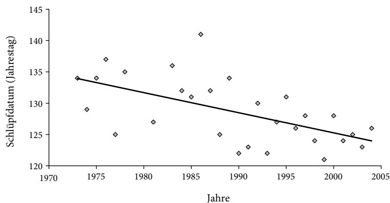
Abb.1: Jahresmittelwerte des Schlüpfdatums von Sitta europaea im „Bahrdorfer Kiefernforst“. Das Schlüpfdatum wurde jeweils durch den betreffenden Jahrestag gekennzeichnet, um der Situation von Schaltjahren Rechnung zu tragen (z.B. 9. Mai 2000 = Jahrestag 130, 9. Mai 2001 = Jahrestag 129). Jahre mit Werten von weniger als 5 Bruten blieben in dieser Zusammenstellung unberücksichtigt. Gerade = Langzeit-Trend (lineare Regression, n = 29, r = -0,60, p < 0,001). – Annual mean hatching date of Sitta europaea in the study area „Bahrdorfer Kiefernforst“. Hatching day was expressed as the number of days within the year to account for leap years (e.g. 9 th of May 2000 = day 130, 9 th of May 2001 = day 129). Years with data of less than 5 broods were excluded from this evaluation. Straight line = long-term trend (linear regression, n = 29, r = -0.60, p < 0.001).

Zur Zeit werden mögliche Folgen der vorausgesagten globalen Klimaveränderung für Vögel und andere Tiere intensiv diskutiert (z.B. Bairlein