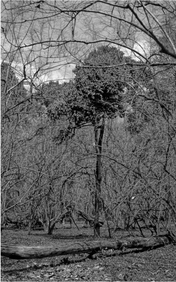
Abb. 2: Inselwald in der Trockenzeit. – Isolated forest during the dry season.