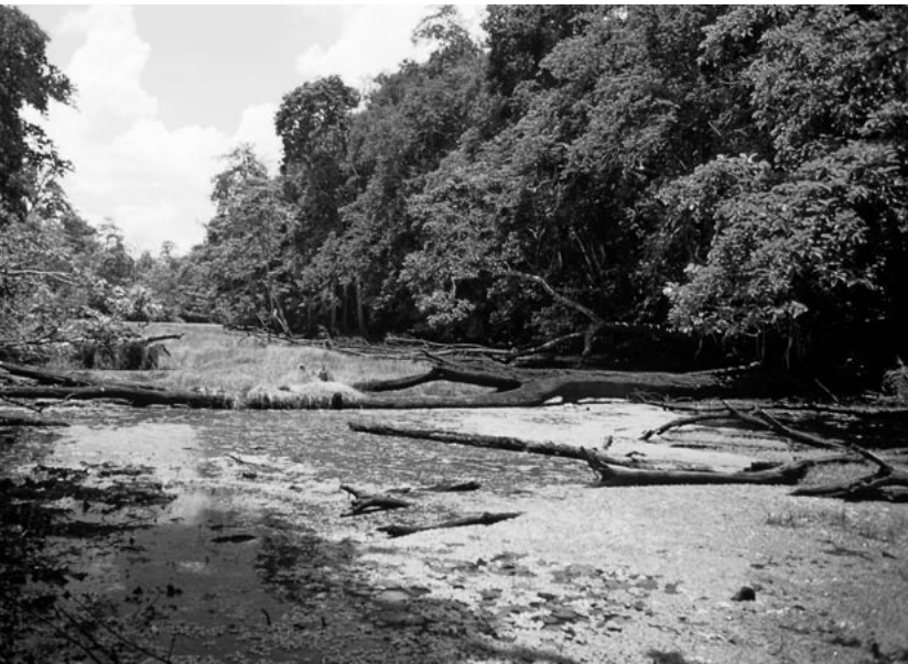
Abb. 3: Galleriewald an einem Altarm des Comoé Flusses. – Gallery forest along the Comoé river.

Mit dem Ziel, mehr über die Habitatwahl und die Nahrungsökologie von paläarktischen Zugvögeln im Vergleich mit ökologisch ähnlichen afrikanischen Arten zu erfahren, untersuchten wir Fitis und Trauerschnäpper Ficedula hypoleuca zwischen 1994 und 1999 im Comoé Nationalpark in der nordöstlichen Elfenbeinküste, Westafrika. Nach einer zusammenfassenden Vorstellung dieser Fallstudie wollen wir (1) die eigenen Ergebnisse mit anderen Untersuchungen zum gleichen Thema vergleichen; (2) diskutieren, ob es ökologische Merkmale gibt, die generell auf Langstreckenzieher zutreffen; (3) die Möglichkeit diskutieren, potenzielle Konkurrenzsituationen zu erkennen und schließlich (4) Schlüsselthemen für die weitere Erforschung der Rolle von gegenseitigen Wechselwirkungen zwischen Zugvögeln und residenten Arten hinsichtlich Evolution und Populationsdynamik aufzeigen.