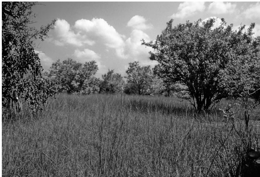
Abb. 1: Busch-/Baumsavanne zu Beginn der Trockenzeit. – Bush/tree savanna at the beginning of the dry season.

Arbeiten von Moreau (1972), Lövei (1989), Leisler (1990, 1992) und Jones (1995, 1998) fassten zusammen, was über die Überwinterungsökologie paläarktischer Zugvögel im Vergleich mit tropischen Arten bis zum jeweiligen Zeitpunkt bekannt war. Im Allgemeinen sollten Zugvögel im Vergleich zu residenten Arten stärker saisonale und offenere Habitat nutzen und flexibler in ihrer Habitatwahl und Nahrungsökologie sein, sich höher, mehr in den Randbereichen der Vegetation und in offenerem Mikrohabitat aufhalten und sie sollten ihre Flügel bei der Nahrungssuche häufiger einsetzen als ökologisch ähnliche afrikanische Arten. Weiterhin sollten sie in direkten Auseinandersetzungen mit residenten Arten unterlegen sein. Es liegen jedoch einige Studien zu Habitatwahl, Mikrohabitatnutzung, Flexibilität bei der Nahrungsökologie oder über Hierarchieverhältnisse zu einheimischen Arten vor, die sich nicht mit dieser allgemeinen Sichtweise decken (Lack 1985, 1986, Jones 1998, Salewski et al. 2002a,b, 2003a).