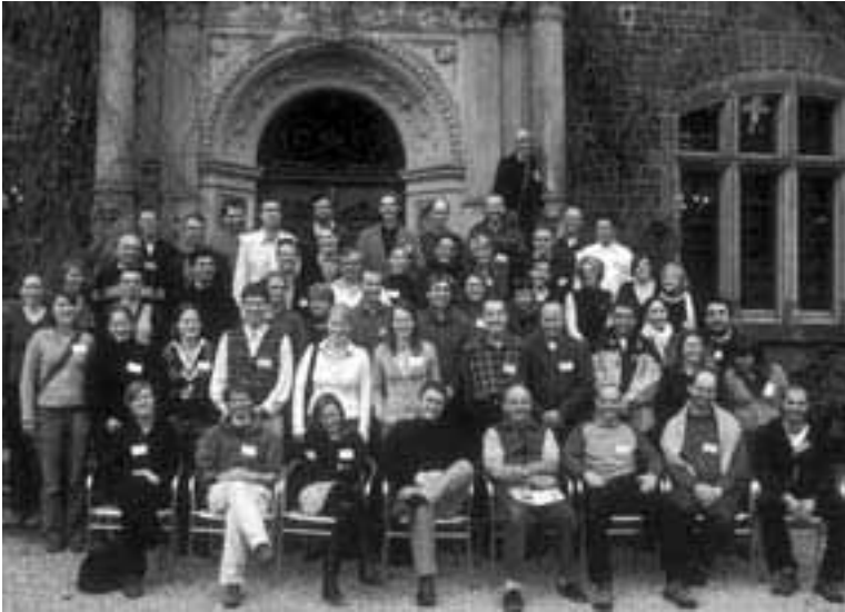
Teilnehmer des Methodenworkshops der PG Habitatanalyse.