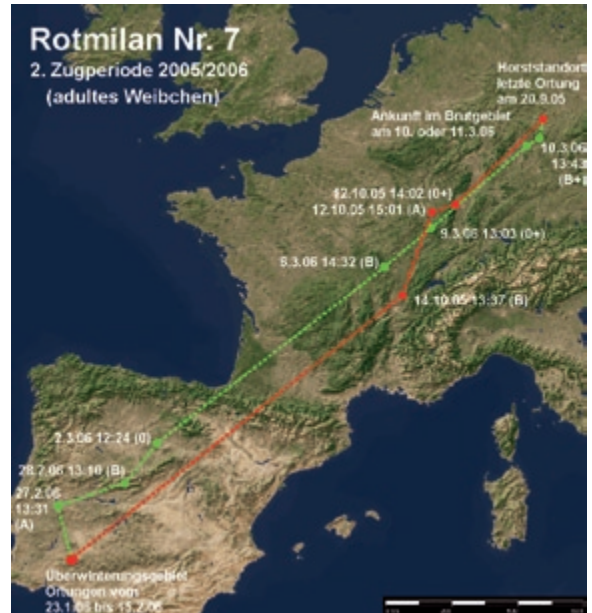
Abb. 7: Weg- und Heimzug des Rotmilans 7 in der Zugperiode 2005/2006. – Autumn and spring migration of the Red Kite 7 in the migration periods 2005/2006.

triert werden konnte. Dafür benötigte er etwa vier Wochen (27–29 Tage). Pro Tag flog der Rotmilan also im Durchschnitt reichlich 80 km.