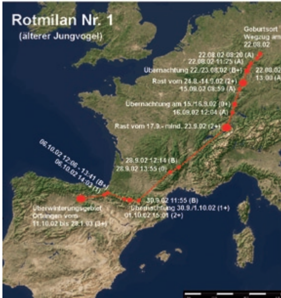
Abb. 2: Wegzug des Rotmilans 1. – Autumn migration of the Red Kite 1.