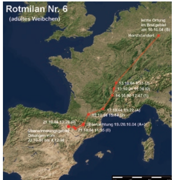
Abb. 5: Wegzug des Rotmilans 6 im Herbst 2004. – Autumn migration of the Red Kite 6 in 2004.

Im Jahr 2004 wurden drei weitere Rotmilane mit PTTs markiert. Das Weibchen Nr. 6 konnte im Sommer 2006 erneut gefangen werden. Es hatte in beiden Jahren nach der Besenderung erfolgreich gebrütet. Da der Sender nur im ersten Jahr auswertbare Daten vom Wegzug nach Spanien geliefert hatte und später nur noch Ortungen in den Sommermonaten stattfanden, wurde er entfernt. Dabei erfolgte eine Untersuchung des Vogels, um festzustellen, ob durch den PTT und seine Befestigung Schäden entstanden waren. Insbesondere wurden das Gefieder und die Hautpartien, an denen die Teflon-