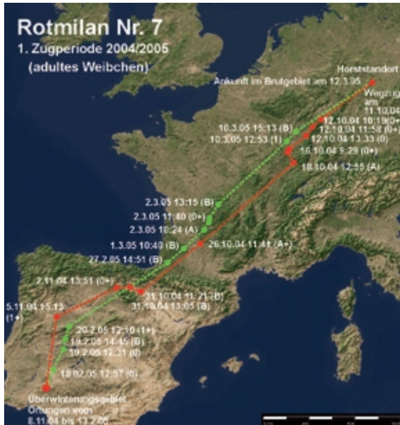
Abb. 6: Weg- und Heimzug des Rotmilans 7 in der Zugperiode 2004/2005. – Autumn and spring migration of the Red Kite 7 in the migration periods 2004/2005.