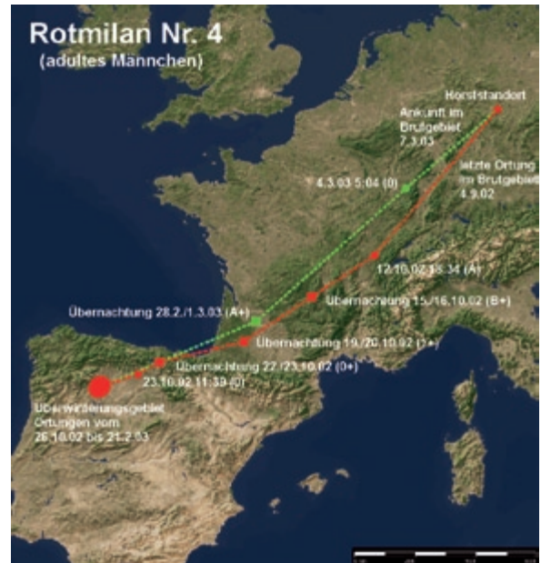
Abb. 4: Weg- und Heimzug des Rotmilans 4. – Autumn and spring migration of the Red Kite 4.

Dieser Rotmilan konnte im Laufe des Winters an vier verschiedenen Schlafplätzen (Tab. 8 C bis F) geortet werden, zwischen denen er teilweise auch mehrfach wechselte. Am 20. Dezember 2002 suchten wir zwei dieser Schlafplätze auf, die 19 km voneinander entfernt lagen. Da recht genaue Ortungen (LC 3) vorlagen, ließen sie sich gut finden. Am Schlafplatz C übernachteten