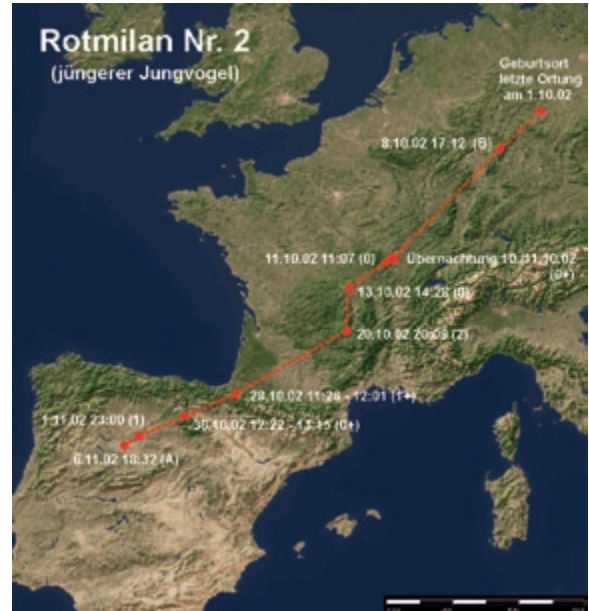
Abb. 3: Wegzug des Rotmilans 2. – Autumn migration of the Red Kite 2.

Angaben zur Zugdauer und der mindestens zurückgelegten Strecke sind Tab. 6 zu entnehmen. Das Winterquartier ist eine von Bergketten begrenzte 600-700 m hoch gelegene Ebene, die landwirtschaftlich meist extensiv genutzt wird. Aussagen über die Ausdehnung dieses Gebietes sind nur eingeschränkt möglich, da von 50 Ortungen in diesem Bereich nur zwei die LC 1 und besser aufwiesen. So lag eine sehr genaue Ortung (LC 3) vom 24. November (N 42° 40' 52", W 3° 29' 31") nur 6,5 ± 3,5 km entfernt von einer Position am 14. Januar (N 42° 39' 32", W 3° 25' 8") der LC 1.