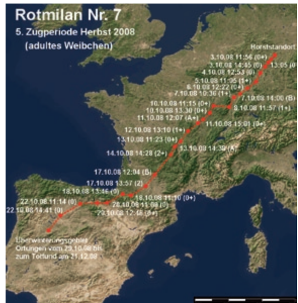
Abb. 9: Wegzug des Rotmilans 7 im Herbst 2008. – Autumn migration of the Red Kite 7 in 2008.