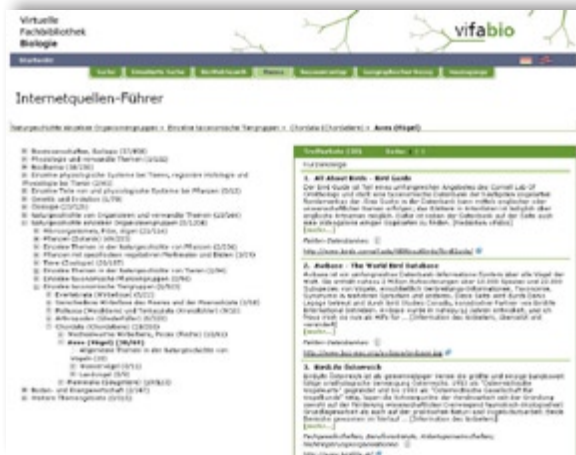
Abb. 7: Browsing im Internetquellen-Führer mithilfe des Themenbaums: Naturgeschichte einzelner Organismengruppen » Einzelne taxonomische Tiergruppen » Chordata (Chordatiere) » Aves (Vögel) – Browsing the Internet Guide with assistance from the subject tree: Natural history of specific kinds of organisms » Specific taxonomic groups of animals » Chordates » Birds.

Von geeigneten Internetressourcen werden neben Titel und Autor z.B. auch Thema, geographischer Bezug und Ressourcentyp erfasst. Der Ressourcentyp beschreibt die Art der Website, ob es sich z.B. um den Webauftritt einer Institution, eine Datenbank, eine Site zu einem Thema oder um eine Mailingliste handelt. Zur thematischen Erschließung wird das hierarchisch