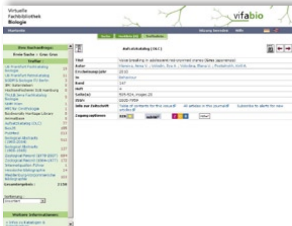
Abb. 4: Virtueller Katalog: Vollanzeige eines Treffers aus dem Aufsatzkatalog OLC mit Links u.a. zu Elektronischer Zeitschriftenbibliothek Regensburg (EZB), Zeitschriftenbibliothek (ZDB), subito und Inhaltsverzeichnis – Virtual Catalogue: Full record of a result from the Catalogue of articles OLC with links to the Electronic Journals Library of Regensburg (EZB), Journal Database (ZDB), subito and table of contents and more.

auf dem Gebiet der Zoologie – sofort mit angezeigt, ebenso die Ergebnisse aus Biological Abstracts 1926-2004. Eine Lösung für bei Nationallizenzen.de ( http://www.nationallizenzen.de/ind_inform_registration ) angemeldete Privatpersonen ist in Planung.