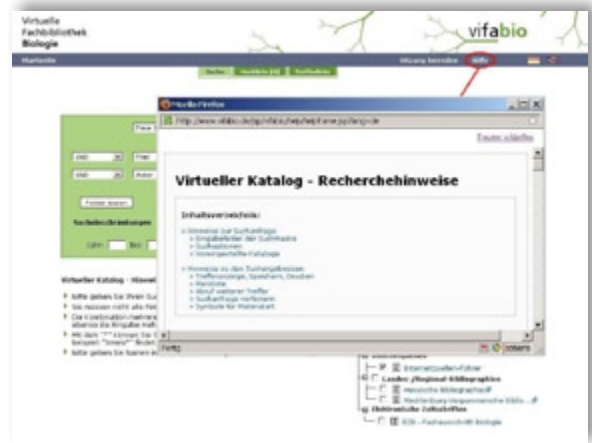
Abb. 5: Virtueller Katalog: Recherchehinweise erreichbar über den Menüpunkt „Hilfe“ – Virtual Catalogue: Search tips available under the „Help“ menu option.

abzuwählen. Neben der Freien Suche über alles kann auch nach Autor, Titel, ISBN/ISSN, Jahr bzw. Verlagsort gesucht werden. Nicht alle Kataloge unterstützen jede dieser Einschränkungsmöglichkeiten, Erläuterungen zu den Suchmöglichkeiten im Detail sind unter dem Menüpunkt Hilfe erreichbar (Abb. 5).