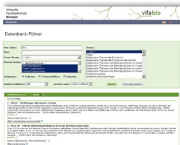
Abb. 9: Trefferanzeige einer Suche nach „bird“ im Datenbank-Führer - Results for a search for “bird” in the Database Guide.

Biologische Online-Datenbanken sind wichtige und häufig nicht leicht zu findende Informationsquellen für Wissenschaftler (Kasperek 2008b). Über den Link Datenbank-Führer sind mehr als 600 Datenbanken gezielt zu erreichen. Es sind sowohl bibliographische Datenbanken erfasst, die Aufsatz- und andere Literaturdaten nachweisen, z.B. Ornithological Worldwide Literature (OWL), als auch Bild- und Faktendatenbanken, die beispielsweise DNA-Sequenzen oder Arten auflisten wie Avibase oder All Birds Barcoding Initiative (ABBI). Die meisten sind kostenfrei über das Internet zugänglich. Eine Suche nach „bird“ zeigt 27 Treffer (Stand Juni 2010; Abb. 9).