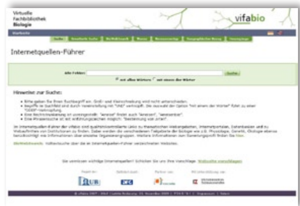
Abb. 6: Eingangsseite Internetquellen-Führer: die Reiter erlauben den Sprung zur Erweiterten Suche, zu BioWebsearch oder zum Browsen

Im Internetquellen-Führer (Abb. 6) werden qualitätsgeprüfte Webpräsenzen aus allen Teilgebieten der Biologie und ihre Metadaten (Titel, Autor usw.) in einer