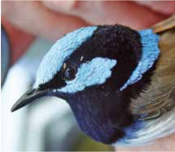
Abb. 3: Vier am Auge des verhaltensauffälligen Prachtstaffelschwanzes Malurus cyaneus cyanocephalus sitzende Federlingslarven ( Myrsidea sp., Menoponidae s. l.). Zwei trinken am Lidrand Augensekret, die anderen sind auf dem Weg dahin. Alle Larven weisen schwarzen Darm- und/oder Kropfinhalt auf, der von gefressenen Federteilchen herrührt. 8.9.2011, Myall Lakes National Park, New South Wales, Australia. – Four feather louse larvae ( Myrsidea sp., Menoponidae s.l.) sitting at the eye of the Superb Fairy-wren Malurus cyaneus cyanocephalus . Two are drinking eye secretion at the edge of the eyelid, the others are on their way there. All larvae show black intestinal and/or crop contents, which are consumed feather fragments.

men. In der Hand gehalten, zeigte sich rasch ein Befall mit Federlingen. Von der Ohrgegend her waren auf der einen Seite zwölf, auf der anderen ca. acht Larven von wahrscheinlich allen drei Stadien einer Myrsidea -Art aus dem Federkleid aufgetaucht und krabbelten flink zu den Augen hin. An den Lidrändern labten sie sich für ca. 10 bis 40 Sekunden an der Tränenflüssigkeit (Abb. 3).