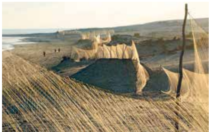
700 Kilometer weit ziehen sich die Fangnetze lückenlos entlang der ägyptischen Mittelmeerküste.