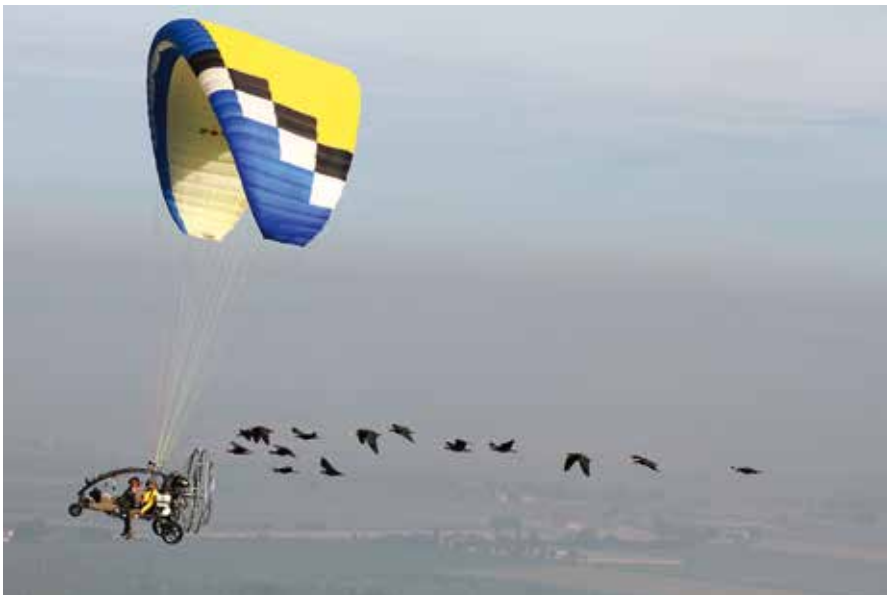
Abb. 1: Menschengeführte Migration 2014. – Human-led migration flight 2014.

Ferner engagierte sich das Waldrappteam auch im marokkanischen Atlasgebirge. Dort war auf Initiative und finanziert von europäischen Zoos eine Zuchtstation mit zwei Waldrapp-Brutgruppen aufgebaut worden. Zielsetzung war die Wiederansiedlung der Waldrappe an historischen Brutplätzen im Atlasgebirge (Müller 2004). Das Waldrappteam wurde beauftragt, einen Projektentwurf für eine Machbarkeitsstudie auszuarbeiten. Zur Umsetzung kam es dann leider nicht, obwohl die struk-