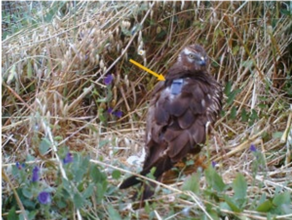
Abb. 8: Weibchen mit heller Iris und GPS-GSM Logger (Pfeil) auf dem Rücken. Am oberen linken Bildrand ist ein Teil der Nestumzäunung zu erkennen. Die helle Iris zeigt ein schon erfahrenes Weibchen. Den Logger erhielt das Weibchen 2017 in derselben Kolonie; so konnten die gesamten Bewegungen des Vogels über ein Jahr dokumentiert werden. – Female with bright iris colour and GPS-GSM datalogger (arrow) on the back. On the upper left one can see part of the fence. Bright Iris colour means that here we have an experienced female. The logger was fixed in 2017 in the same colony; so all the movements of the bird for the past year could be documented.