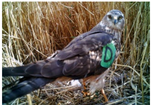
Abb. 7: Einjähriges Weibchen mit dunkler Iris und Flügelmarkierung. Junge Weibchen zeigen eine dunkle Färbung der Iris, welche sich nach drei bis vier Jahren in ein helles Gelb verwandelt. Die Flügelmarkierung erhielt das Weibchen in Talarubia, ca. 50 km nordöstlich, 2017 als Jungvogel. – One year old female with dark iris colour and wing tags. Young females show a dark iris colour that turns to bright yellow after three to four years. Wing tags were fixed in Talarubia, about 50 km north-east in 2017 when fledged.