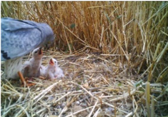
Abb. 4: In sechs Nestern konnten Männchen gelegentlich bei der Fütterung beobachtet werden. – In six nests, males could be found occasionally feeding the chicks.