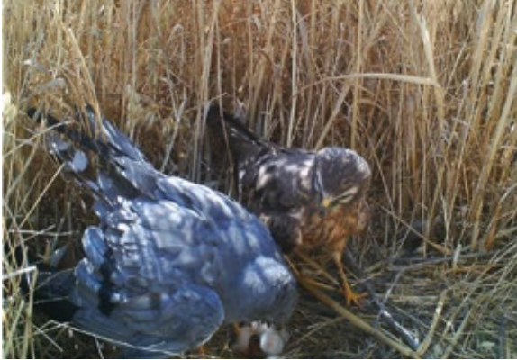
Abb. 2: Männchen der Wiesenweihe waren in 21 von 29 Nestern regelmäßig am Nest zu beobachten. – Males of Montagu's harrier were regularly (21 of 29 nests) seen at the nest.