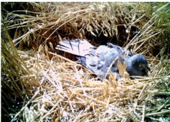
Abb. 6: Einmal nach der Prädation (ein Ei blieb zurück) und in zwei nicht prädierten Nestern, die von den Weibchen bereits aufgegeben worden waren, versuchten die Männchen die Bebrütung der Eier fortzusetzen. – In one nest after predation (one egg had left) as well as in two other nests (not predated) that had been abandoned by the females, males tried to incubate the eggs.