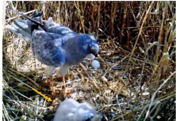
Abb. 5: Männchen bringt eine Eidechse (Pfeil) ins Nest. In drei Nestern brachte das Männchen regelmäßig die Beute ins Nest. – Male carrying a lizard (arrow) to the nest; we observed males bringing regularly food in three nests.