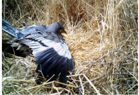
Abb. 3: In elf Nestern waren Männchen bei hohen Temperaturen regelmäßig als Schattenspender für Eier und kleine Küken zu sehen. – In 11 nests, males used to shade eggs and small chicks during periods of high temperatures.