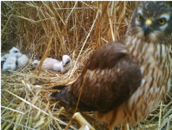
Abb. 9: In einem Nest schaute das Weibchen oft in die Kamera. – In one nest, the female often observed the camera.

als das Weibchen. In zwei Fällen war noch ein Ei im Nest verblieben; hier versuchten die Weibchen am folgenden Tag, das Ei weiter zu bebrüten (in einem Fall auch das Männchen, 2018; s. Tab. 1, letzte Spalte "e").