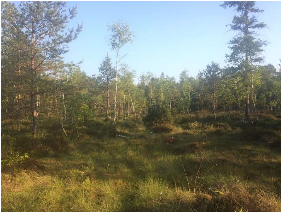
Abb.4: Hochmoorrest und Moorwald im Kerngebiet des Wildmooses