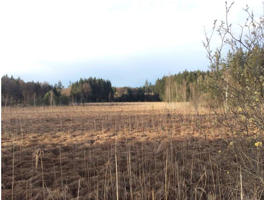
Abb.3: Stark verbultete ehemalige Streuwiese südlich Haus Birkenstein

Die Route umfasst Wiesengebiete, Wälder, Streuwiesen und einen kleinen Teil des Mooregebiets im Zentrum des Naturschutzgebiets Wildmoos.