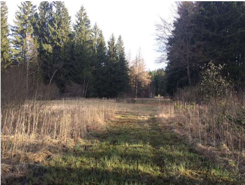
Abb.6: Auf dem Weg zur südlichen Pfarrwiese