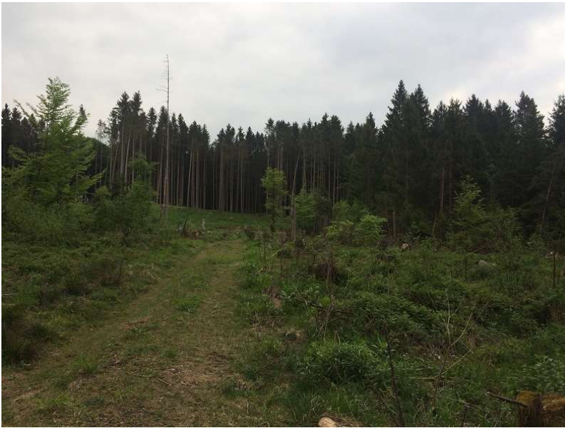
Abb.5: Wirtschaftswald im Osten des Untersuchungsgebiets