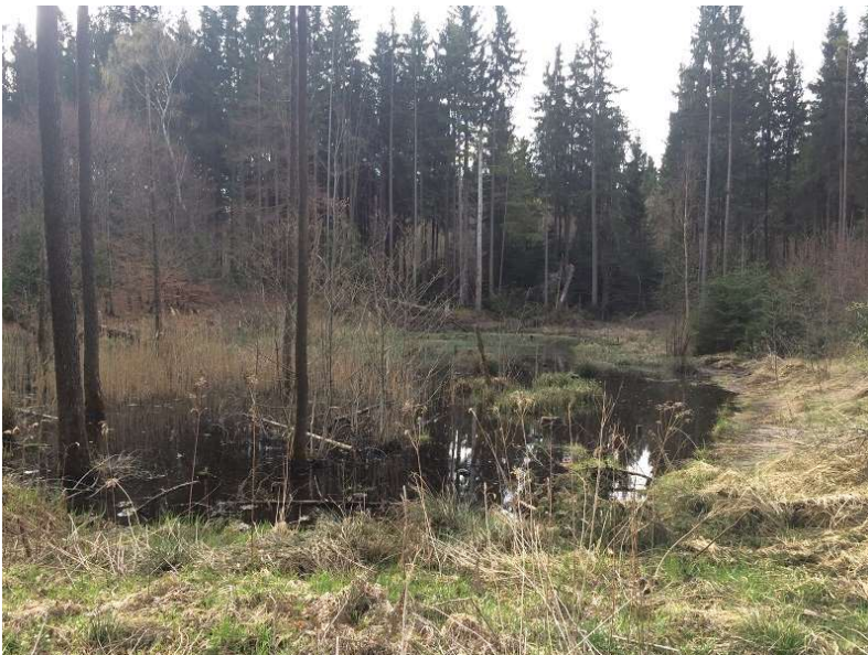
Abb.7: Toteisloch, von LBV und Forstbetrieb München freigestellt