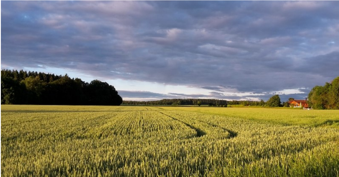
Gewitterstimmung im Juni, Blick nach Süden

Der ca. 5 km lange Rundweg (auf der unten stehenden Karte blau gekennzeichnet) beginnt im Süden von Pentenried verläuft dann am Waldrand entlang und anschließend Richtung Norden zwischen Feldern durch den nördlichen Teil (Gut) Pentenried. Sodann geht es 500m an der Straße bis zum Gartenbetrieb „Gartenzwerge“. Hier biegt man in den Feldweg ein bis zu einem kleinen Wäldchen. Der Weg führt weiter südlich nach Unterbrunn. Die St 2349, Verbindungstrasse von Unterbrunn und Gauting wird überquert. Nach dem Passieren des rechts liegenden Pferdehofes folgt man den Feldwegen, biegt zweimal links ab und gelangt so zur St 2349, die ein zweites Mal überquert wird. Der Rest des Weges führt durch den Wald zurück nach Pentenried.