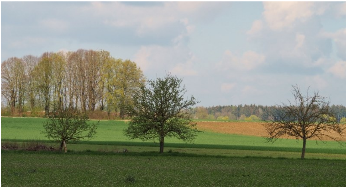
Zwischen Unterbrunn und Gauting, Blick nach Westen im April

Das Untersuchungsgebiet zwischen Unterbrunn, Gauting und Pentenried ist eine klassische Agrarlandschaft, mit vorwiegend Getreide-, Raps und Maisfeldern, schmalen Wildkräuterstreifen an den Feldwegen und vereinzelt Bäumen und Büschen.