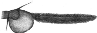
Fig. 1. Innenseite eines Fühlers von Chilosia atriseta n. sp.

Das Tier ist schwarz mit grauweißer, im ganzen kurzer Behaarung; rot ist nur das dritte Fühlerglied. Die Fühlerborste ist zu