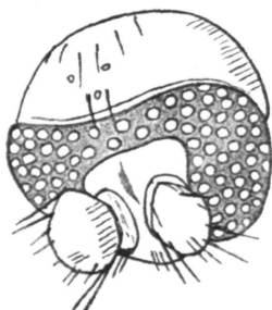
Fig. 2. Epidapus atomarius Dg. ♀. Kopf von oben.

Absoloni mihi wirklich zur Gattung Epidapus gehören. H. Schmitz, dem ich einige Exemplare zur Untersuchung sandte, verwies darauf, daß Schiner 1) , Winnertz 2) und van der Wulp 3) der Haliday'schen Gattung Epidapus viergliedrige Taster zuschreiben. Die Fliege aber, die ich als Epidapus atomarius beschrieben habe, besitzt, wie eine genaue Prüfung an vielen Exemplaren und in beiden Geschlechtern ergab, 4) einen eingliedrigen Maxillarpalpus (den Trochanter ausgenommen); der Maxillarpalpus ist oval, trägt an der Außenseite eine längere Borste und apikal mehrere, hyaline