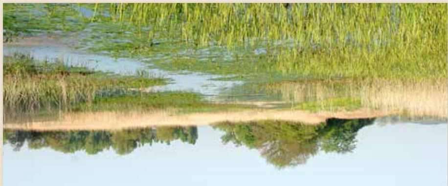
Durch die regelmäßige Lebensräume und für die Auen so wichtigen Überflutungen haben sich über die Zeit einzigartige Lebensräume für Tiere und Pflanzen entwickelt.