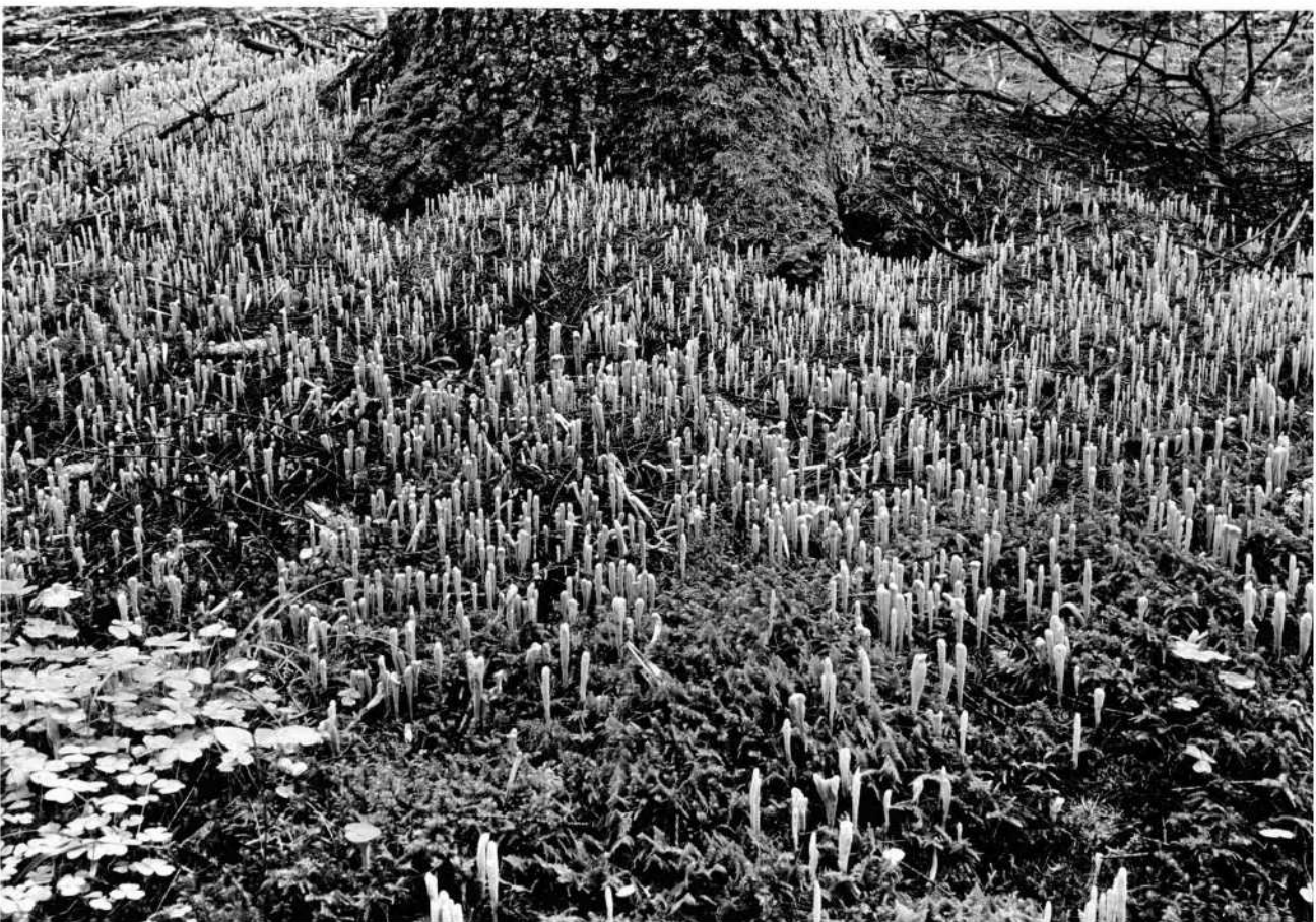
Massenbestand der Zungenkeule Clavariadelphus ligula (Fr.)Donk