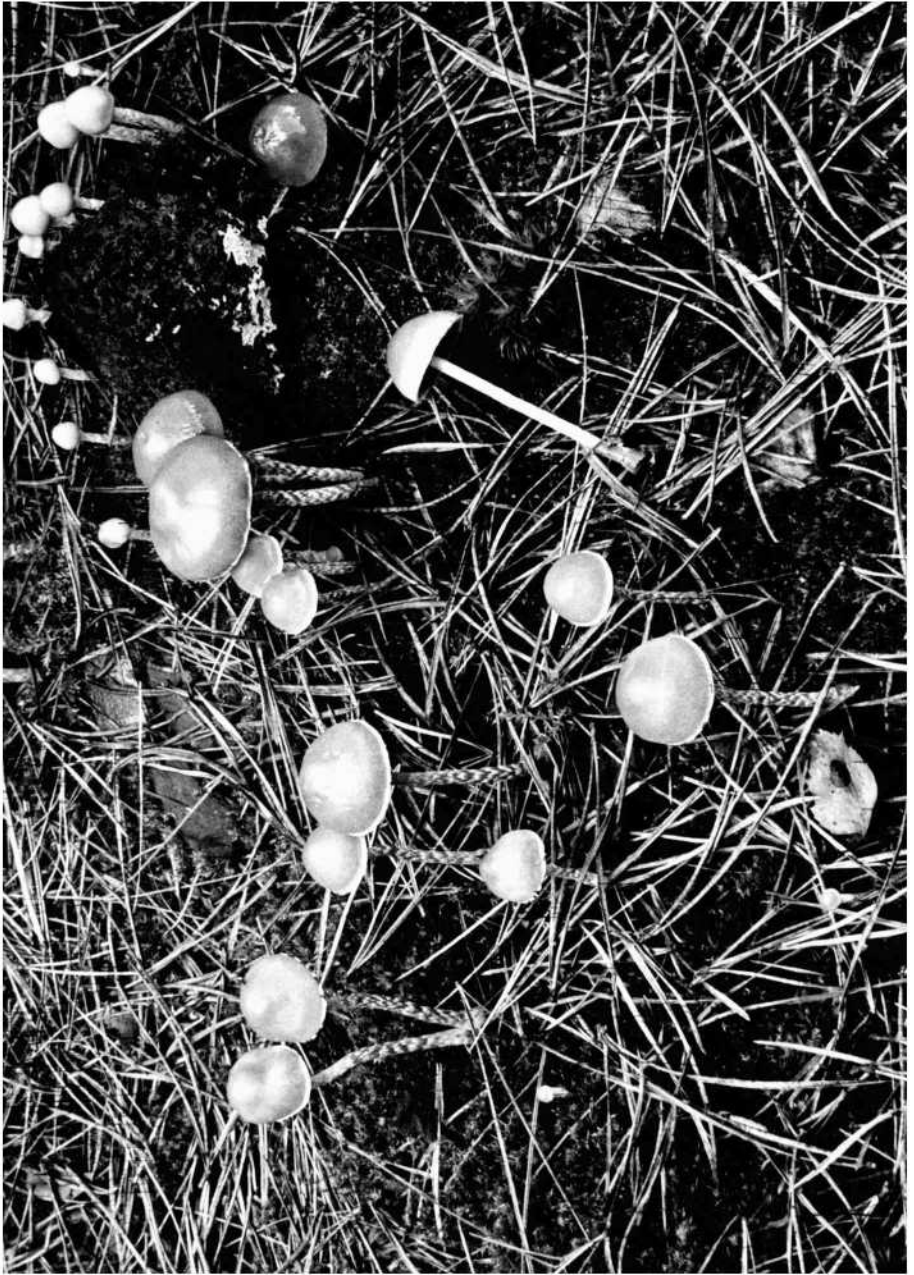
Naematoloma dispersum (Fr.) Karst.