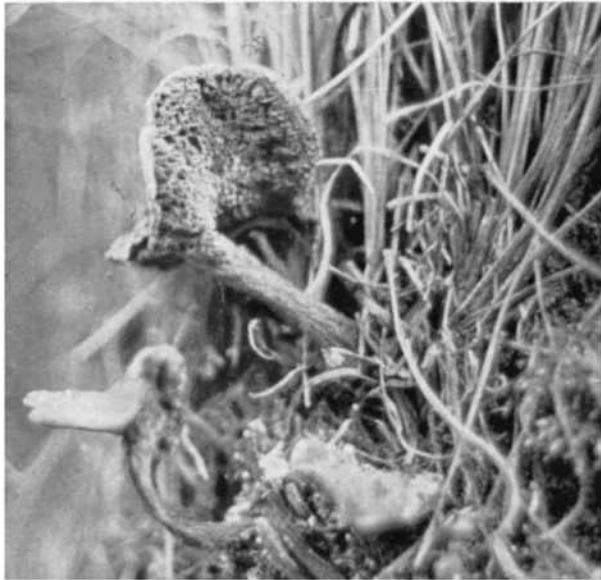
Fig. 1: Polyporus rhizophilus Pat. auf einem Horst des Walliser Schwingels ( Festuca valesiaca) bei Müheln (Krs. Merseburg). 26. 8. 1961.

bilden. Nur nahe der oberen Hangkante, welche unmittelbar an das ackerbau-lich genutzte Plateau des Berges angrenzt, finden sich mehrfach tiefgründigere Stellen, die ihre Entstehung einer Lößeinwehung vom Acker her verdanken und die \pm geschlossene Trockenrasen mit deutlich kontinentalem Arealtypenspektrum tragen. Hier dominieren bei weitem die üppigen Horste der beiden Steppengräser Festuca valesiaca und Stipa capillata , zwischen denen nur vereinzelt wenige andere Phanerogamen wie Veronica prostrata , Astragalus exscapus , Podospermum laciniatum , Arenaria leptoclados und Eryngium campestre Platz finden. In einem solchen Stipetum fand ich am 26. 8. 1961 am Grunde eines Horstes von Festuca valesiaca drei schon stark vertrocknete Fruchtkörper des Steppenporlings, die wohl schon im Frühjahr 1961 gebildet worden waren. Der Walliser Schwingel ist in der bisherigen Literatur noch nicht als Wirtsgras dieses Pilzes angegeben worden. Dafür werden mehrere andere Steppengräser genannt, so vor allem Stipa capillata , aber auch S. joannis , S. pulcherrima , S. lessingiana , Agropyron intermedium , Bothriochloa ischaemum , Cynodon dactylon sowie Arten aus den Gattungen Digitaria und Elymus .