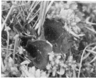
Abb. 3: Pseudoplectania sphagnophila (Fr.) Kreisel, Gruppe von Fruchtkörpern am natürlichen Standort. Mümmelken-Moor (Insel Usedom), 16. VI. 1961.

Sicherlich sind Peziza melaena var. sphagnophila Fr. und Pseudoplectania nigrella var. episphagnum Favre dasselbe. Zu welcher Art ist unser Pilz nun wirklich zu stellen? Behaarung und Paraphysenform stimmen mit Ps. nigrella überein, Stielbildung und Verkitten der Paraphysen verweisen auf Ps. melaena ; Standort und geringe Fruchtkörpergröße unterscheiden unseren Pilz von beiden verwandten Arten (vergl. die Tabelle!). Ich meine daher, daß es sich um eine gute, selbständige Art handelt und schlage — auf den älteren Namen zurückgreifend — folgende Benennung vor: