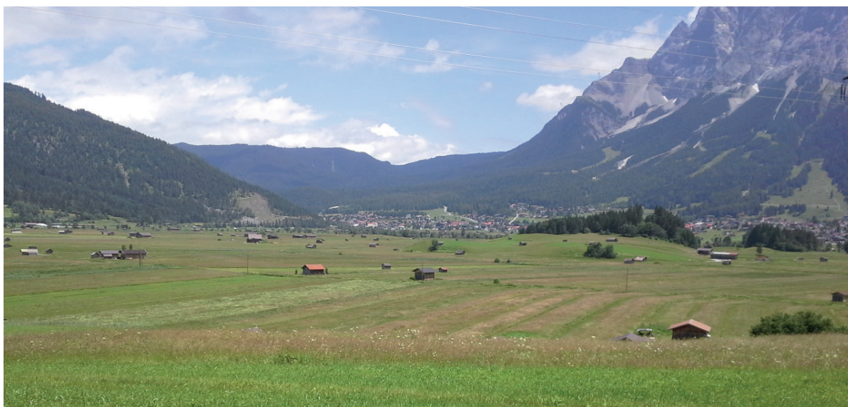
Abb. 4: Im Ehrwalder Becken (ca. 1000 m Seehöhe) brüten noch ca. 60% der Braunkehlchen Reviere erfolgreich.- In the Ehrwalder basin with an altitude of about 1000 m 60% of the Whinchats are breeding successful.