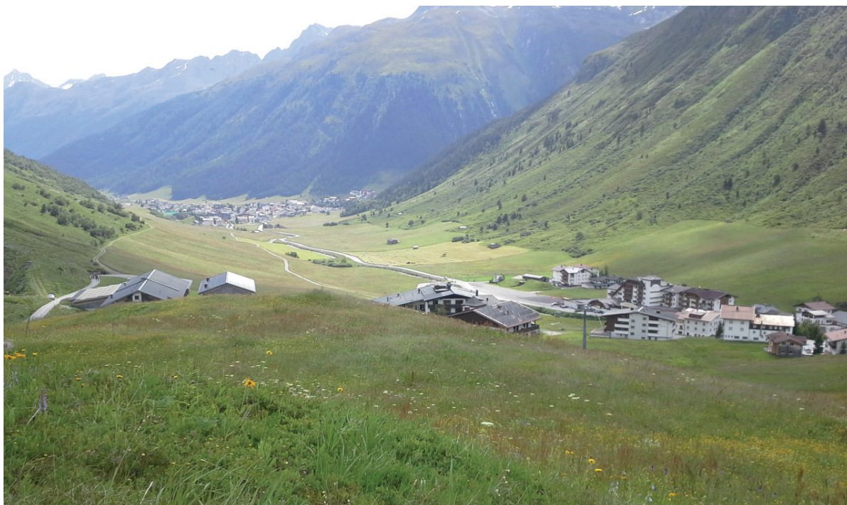
Abb. 5: In Galtür auf über 1600 m Seehöhe sind vor allem die an die Wiesen angrenzenden (auch steilen) Weideflächen wichtiges Bruthabitat.- In Galtür with an altitude of more than 1600m especially the pastures adjacent to meadows (also the steep ones) are important breeding habitats.

Die Kerngebiete der Braunkehlchenvorkommen befinden sich im Bezirk Landeck (inneralpine Trockengebiete, im grenznahen Bereich zur Schweiz und Südtirol) und Imst (v.a. Ehrwalder Becken an der Grenze zu Bayern).