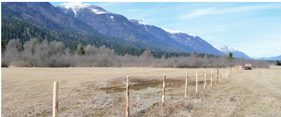
Abb. 6: 2017 aufgestellte Sitzwarten in Waidegg, Oberes Gailtal. - Deployed perches in Waidegg, Oberes Gailtal, 2017 (Photo: © Andreas KLEWEIN).

BirdLife Kärnten arbeitet derzeit in Kooperation mit dem Land Kärnten und den Landwirten im Gailtal für den Erhalt einer der letzten Braunkehlchen-Populationen sowie an der