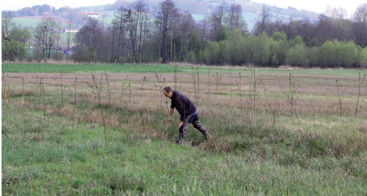
Abb. 3: Kremsauen, April 2017: 350 temporäre Warten auf 4 ha strukturarmen Mähwiesen ausgebracht. - Kremsauen, April 2017: Spreading of 350 temporary perches on 4ha meadows with a lack of structure.

riger. In allen anderen Vorkommensrelikten des Landes ist davon auszugehen, dass der Bruterfolg noch deutlich darunter liegt. Der zu geringe regionale Bruterfolg ist demnach als Hauptursache für die Bestandseinbrüche belegt.