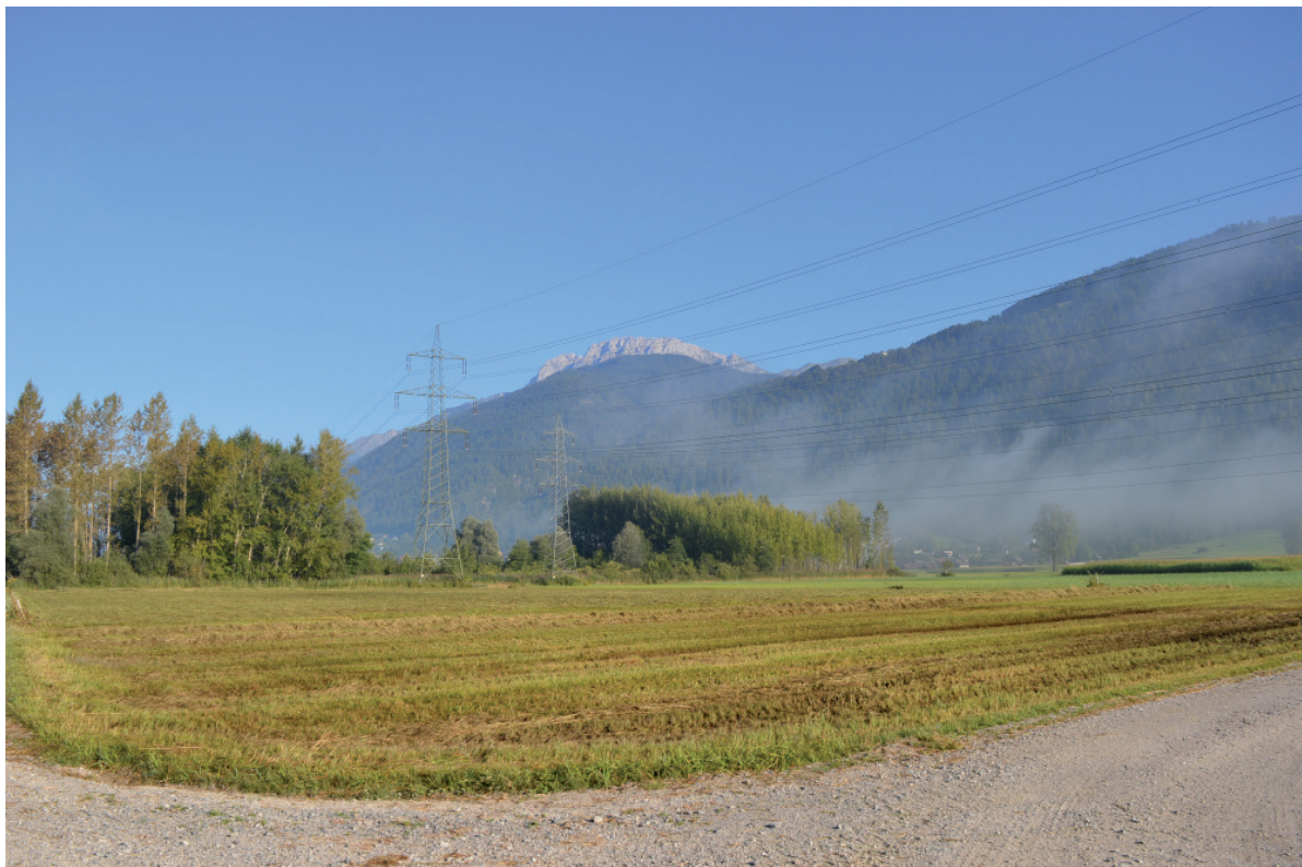
Abb. 7: Feuchte Spätmähwiese mit Braunkehlchen-Brutvorkommen, nach der Mahd, Waidegg, Oberes Gailtal. - Late mown meadow with breeding occurrence of the Whinchat, photographed after mowing, Waideck, Oberes Gailtal.

Etablierung einer an das Braunkehlchen abgestimmten Bewirtschaftung. Dazu zählen Spätmähwiesen, die Aufstellung von Ansitzwarten und die Umwandlung von Acker- in Grünland.