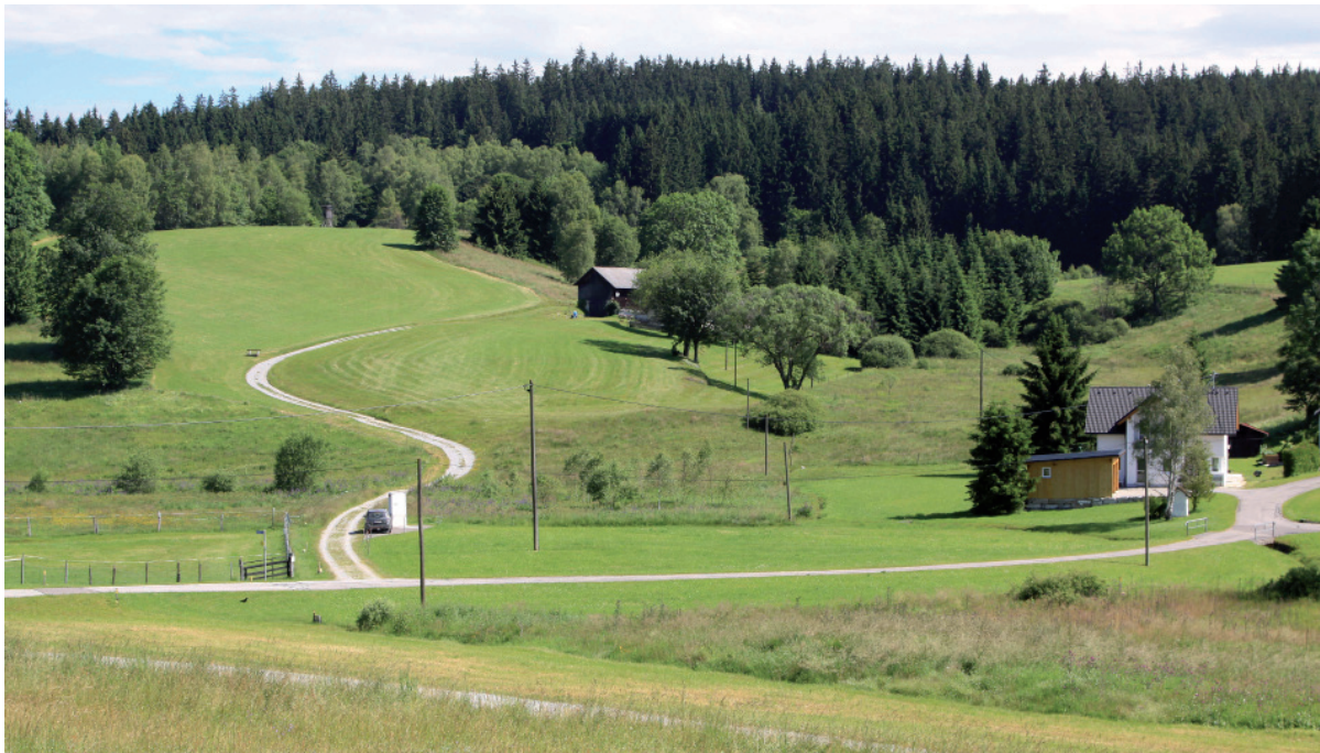
Abb. 2: Der höchste Bruterfolg wurde im SPA Freiwald in wartenreichen Wiesenbrachen (Sandl-Graben) festgestellt. - The highest breeding success was determined in the SPA Freiwald in fallow land with many perches.

In den drei Zähljahren waren von summierten 98 Paaren 64 Paare mit 202 flüggen Jungvögeln erfolgreich. Die Bruterfolge im Durchschnitt: 2008: 2,4/Paar, 2012: 1,6/Paar, 2016: 2,3/Paar; Die Bruterfolge lagen demnach selbst in diesen besten Braunkehlchen-Habitaten der Vogelschutzgebiete in den Jahren 2008 und 2016 unter dem Wert für vitale Populationen von, 2,6 flüggen Jungvögeln/Paar, im Jahr 2012 sogar erheblich niedriger.