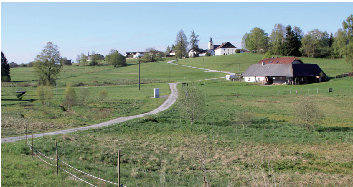
Abb. 3: Braunkehlchen-Habitat in Sandl/Graben: In den Wiesenbrachen mit hoher Dichte von Sitzwarten erzielen die Braunkehlchen den besten Bruterfolg. - Whinchat habitat in Sandl/Graben. In fallow land with a high density of perches whinchats obtain the highest breeding success.

Den höchsten Bruterfolg erzielte die kleine Population in der Dürnau im unmittelbaren Grenzstreifen zu Südböhmen. Mit 3,05 Jungvögeln/ Paar liegt der Reproduktionserfolg hier im Bereich für vitale Vorkommen. Nur diese und die