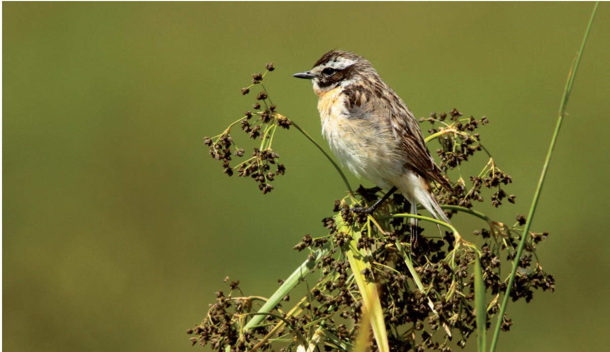
Abb. 1: Braunkehlchen auf Sitzwarte im SPA Maltsch, 1.7.2017. - Whinchat on a perch in SPA Maltsch, 1 July 2017.

paaren (67%) Bruterfolg. Das erscheint als sehr hoher Wert, vergleicht mit etwa mit einer Studie in der Schweiz, in der von 172 Paaren 88 bzw. 51% erfolgreiche Bruten aufwiesen (LABHART 1988). Allerdings verweist schon die durch-